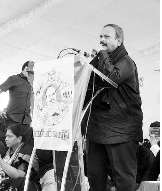
హామీలలో ఏ ఒక్క హామీ నెరవేరేకపోగా ప్రజలను పంచించారన్నారు.