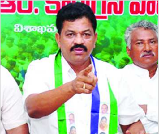
ఎన్ఎన్టీఎల్ గోడ తొలగించేలా చర్యలు చేపట్టాలి