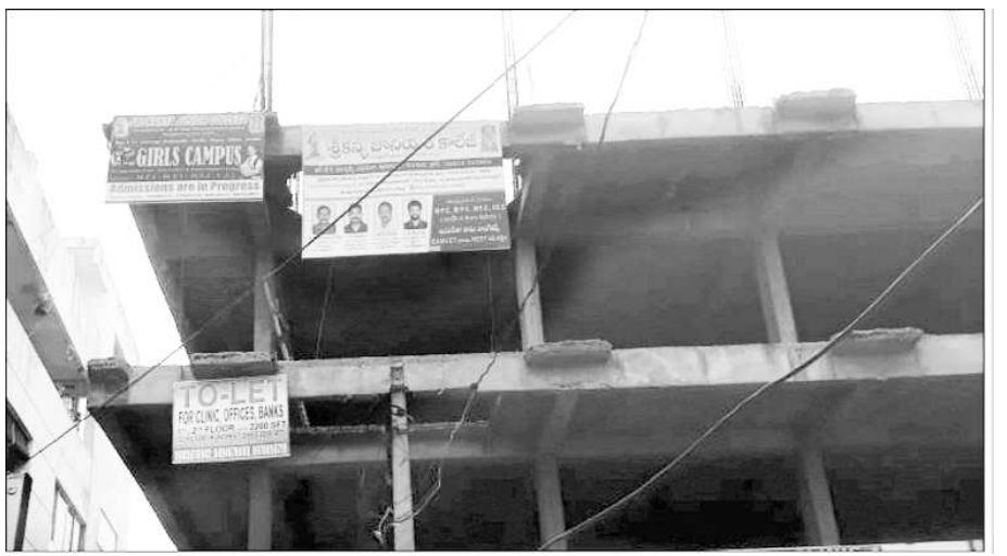
అనుమతులు లేని శ్రీకృష్ణ గర్బ్ క్యాంపస్

అనుకాపల్లి : ఇంటర్మీడియట్ బోర్డు అనుమతి లేకుండా పట్టణంలో శ్రీకృష్ణ కళాశాల ఆదనపు క్యాంపస్ నిర్వహిస్తున్న ఈ విషయం బోర్డు అధికారులకు పట్టకపోవడం ప్రస్తుతం కళాశాల వర్గాల్లో చర్చాంశనియంగా మారింది. వివరాలలోకి వెళ్తే శ్రీకృష్ణ కాలేజీ యాజమాన్యం ఎలాంటి అనుమతులు లేకుండా రెండవ బ్రాంచుని ప్రారంభించి, దానికి శ్రీకృష్ణ జూనియర్ కాలేజీ గర్బ్ క్యాంపస్ అనే పేరుపెట్టి ఇప్పటికే ఆ క్యాంపస్ లో అడ్మిషన్లు చేపట్టడమే కాకుండా వాటి రూపంలో ఒకొక్క విద్యార్థి నుండి వేల రూపాయలు మొత్తంలో ఫీజులు గుంజింది.