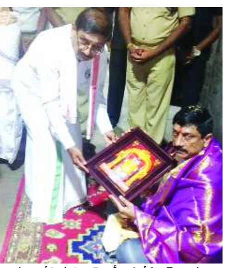
అమలుచేస్తామని ప్రాండ్లీ పోలీసింగ్ అమలు చేస్తూ ప్రజలకు మా సేవలు అందిస్తామని అయిన తెలిపారు.