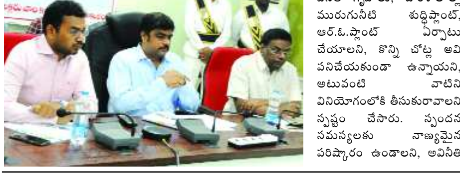
వసతి గృహాలు, పాఠశాలల్లో మురుగునీటి శుద్ధిప్లాంట్, ఆర్.ఓ.ప్లాంట్ ఏర్పాటు చేయాలని, కొన్ని చోట్ల అవి పనిచేయకుండా ఉన్నాయని, అటువంటి వాటిని వినియోగంలోకి తీసుకురావాలని స్పష్టం చేశారు. స్పందన సమస్యలకు నాణ్యమైన పరిష్కారం ఉండాలని, అవినీతి

శ్రీకాళుః: ఇళ్లు లేని నిరుపేదలందరికీ వచ్చే ఉగాది నాటికి ఇళ్ల స్థలాలను పంపిణీ చేయాలని, అందుకు అవసరమైన అన్ని చర్యలు చేపట్టాలని రాష్ట్ర ముఖ్యమంత్రి వై.యస్.జగన్మోహన్ రెడ్డి జిల్లా కలెక్టర్లను ఆదేశించారు. మంగళవారం ఇళ్ల స్థలాల పంపిణీ, స్పందన, వసతి గృహాలు, పాఠశాలల్లో మౌలిక సదుపాయాలు, గృహ నిర్మాణాలు తదితర అంశాలపై రాష్ట్ర ముఖ్యమంత్రి జిల్లా కలెక్టర్లతో వీడియో కాన్ఫరెన్స్ను నిర్వహించారు. ఈ సందర్భంగా ముఖ్యమంత్రి మాట్లాడుతూ ఇళ్ల స్థలాల పంపిణీ, గృహనిర్మాణాల కొరకు రూ.5 వేల కోట్లను బడ్జెట్ లో కేటాయించడం జరిగిందని పేర్కొన్నారు. కుటుంబ మహిళ పేరుతో పట్టాను మంజూరు చేయాలని ముఖ్యమంత్రి కలెక్టర్లను ఆదేశించారు. గ్రామాన్ని యూనిట్ గా తీసుకోవాలని, 25 లక్షల గృహాలు నిర్మించడమే ప్రభుత్వ లక్ష్యమని చెప్పారు. స్పందనపై మాట్లాడుతూ విద్యా సంస్థలు, వసతి గృహాల్లో పరిస్థితులు మెరుగుపడాలని తెలిపారు. క్షేత్రస్థాయి పర్యటనలో భాగంగా విద్యాసంస్థల్లో మౌలిక సదుపాయాల కల్పనకు ప్రకటించిన రూ.14 కోట్లలో రూ.7 కోట్ల చొప్పున ముందస్తుగా నిధులు విడుదల చేయడం జరిగిందని అన్నారు.