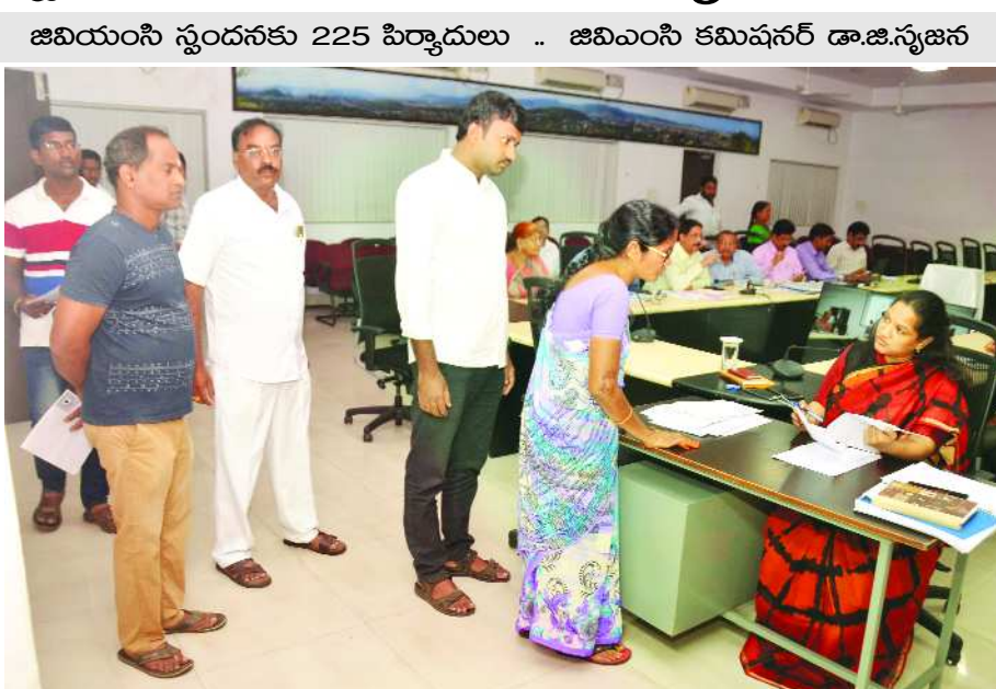
జివియంసి స్టందనకు 225 పిర్యాదులు .. జివియంసి కమిషనర్ డా.జి.స్వజన

విశాఖపట్నం,: జివియంసి కమిషనర్ డా.జి.స్వజన స్టందన కార్యక్రమంలో సోమవారం ఫిర్యాదుదారులనుండి ఫిర్యాదులను స్వీకరించారు.