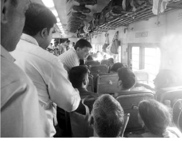
పియాఠిలు అందుతున్న నేపథ్యంలో ఆయన ఈ ఆకస్మిక పర్యటన చేపట్టడం గమనార్హం.

దిల్లీ: కేంద్ర రైల్వేశాఖ మంత్రి పీయూష్ గోయల్ రైల్వే ప్రయాణించారు. ఆదివారం కోట జనశతాబ్ది రైల్వే ఆయన ఆకస్మిక తనిఖీలు చేపట్టారు. రైల్వే సదుపాయాలు ఎలా ఉన్నాయో విషయాన్ని ఆయనే స్వయంగా ప్రయాణికులను అడిగి తెలుసుకున్నారు. ప్రతీ బోగీలోని ప్రయాణికులను కలుసుకొన్న ఆయన వారిలో కొద్దిసేపు మాట్లాడారు. ఇటీవల కాలంలో రైల్వేలో సరైన సదుపాయాలు లేవంటూ ప్రయాణికుల దగ్గర నుంచి