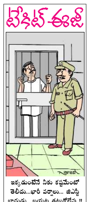
జక్కడుంటే ఏక కష్టమేంటో తెలిపి...భారీ వర్షాలు... జిఎస్ బాడుడు.. బయట తట్టుకోలేవు !!