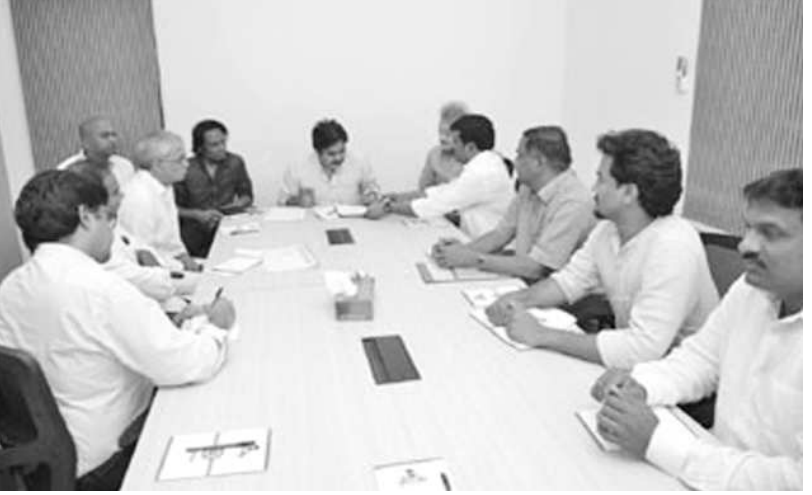
చర్చించినట్లు తెలుస్తోంది. 2019లో ఎన్నికల నేపథ్యంలో ఏ విధంగా ముందడుగు వేయాలనేదానిపైనూ ఈ భేటీ చర్చించినట్లు సమాచారం.

హైదరాబాద్: జనసేన పార్టీ సంస్థాగత నిర్మాణంలో భాగంగా ఆ పార్టీ అధినేత పవన్ కీలక నిర్ణయం తీసుకున్నారు. త్వరలోనే జనసేన పార్టీ పీసీసీ నిర్వహించాలని భావిస్తున్నారు. అయితే దీనిపై ఇంకా తుది నిర్ణయం తీసుకోలేదు.. త్వరలోనే తుది నిర్ణయాన్ని పవన్ స్వయంగా వెల్లడిస్తారని పార్టీ వర్గాలు చెబుతున్నాయి. జనసేన ఆవిరైపోయే నాటి నుంచి ఇప్పటి వరకూ ఇంత సీరియస్ గా జనసేన పార్టీ కోర్ కమిటీ భేటీ జరగలేదు. ఇలాంటి తరుణంలో ఆదివారం ఇక్కడి పార్టీ కార్యాలయంలో ముఖ్య ప్రతినిధులతో పవన్ కీలక సమావేశం నిర్వహించారు. ఈ భేటీలో వచ్చే 6 నెలల్లో పార్టీ పరంగా నిర్వహించనున్న ముఖ్య కార్యక్రమాలపై పవన్ చర్చించారు. అదేవిధంగా రెండు రాష్ట్రాల్లో ఎప్పుడు పర్యటించాలనే అంశంపైనూ జనసేన కోర్ కమిటీ