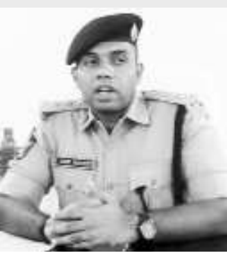
వేసవికాలంలో అధికంగా దొంగతనాలు జరుగుతాయని, ప్రజలు అప్రమత్తంగా ఉండాలన్నారు. ముఖ్యంగా శారదానగర్, శివపురం ప్రాంతాల్లో మరింత భద్రత కల్పిస్తున్నామన్నారు.