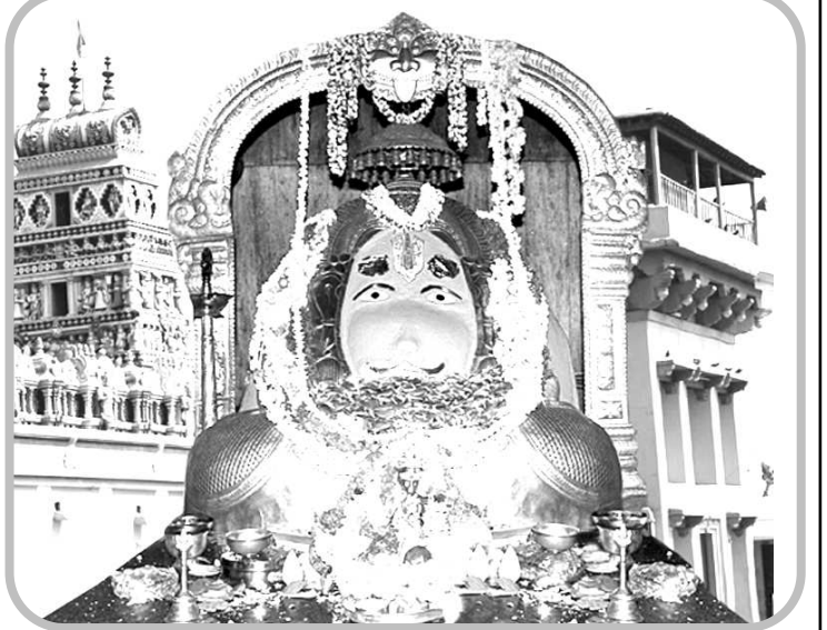
మనసుకు ప్రశాంతత చేకూరు తుంది. కొత్తగా కొనుగోలు చేసిన మోటార్ వాహనాలకు ఇక్కడ పూజ చేయించడం సంప్రదాయం. నిత్యం అనేక వాహనాలకు శకల పూజ జరుగుతుంది. ఇలా చేరుకోవచ్చు హైదరాబాద్ నగరంలోని ఇస్కంట్ రింగ్ రోడ్డు సమీపంలో ఆలయం వుంది. దిల్ సుఖ్ నగర్, ఎల్ వీ నగర్ నుంచి చేరుకోవచ్చు. మీర్ పేట్, జిల్లెల్ గూడ, నాదగల్ గల్, ఆర్.ఎన్.రెడ్డి నగర్... తదితర శివారు ప్రాంతాలకు వెళ్ళే సీట్ సర్వీసులు కర్మనఘాట్ మీదుగానే వెళతాయి.

స్వయంగా దాడికి దిగాడు. ఈ క్రమంలో ఆలయం వద్దకు చేరుకోగా ఆలయం నుంచి పెద్ద స్వరంతో 'మందిర తోడినా హైతో పహారే తుమ్ కరో మనఘట్' (ఆలయాన్ని ధ్వంసం చేయాలనుకుంటే మనస్సును గట్టిగా చేసుకో) అని పలికింది. దీంతో ఔరంగజేబ్ తనకు కనపడమని కోరగా తాటిచెట్టు కంటే ఎత్తైన రూపం కనిపించడంతో అతను భీతిల్లి వెనుదిరిగాడు. కరో మనఘట్ అన్న పేరే కర్మనఘాట్ గా మారింది. నిత్యపూజలు స్వామివారి ఆలయంలో నిత్యపూజలు జరుగు తుంటాయి. రోజూ వందలాది మంది భక్తులు స్వామి వారి దర్శనం కోసం వస్తుంటారు. ఈ ఆలయ ప్రాంగణంలో పలు ఉపాలయాలను నిర్మించారు. ప్రశాంతమైన వాతా వరణంలో వుండే ఆలయంలో స్వామివారి మూలవిరాట్ విగ్రహాన్ని దర్శించుకుంటే