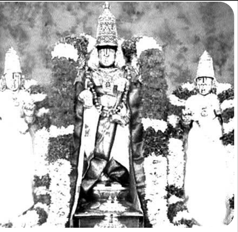
చేరుకోవడానికి వరుస వద్దకు రావాలి ఉంటుంది. ప్రత్యేక ప్రవేశ దర్శనం టిక్కెట్లను నిత్యం రూ.300 ధర వంతున 26వేల టిక్కెట్లను అందుబాటులోకి తీసుకువచ్చింది. 56 రోజులకు ముందుగా టిక్కెట్లను పొందే అవకాశం ఉంది. విశేష పర్వదిన్నాల్లో రద్దీని దృష్టిలో ఉంచుకుని టిక్కెట్ల సంఖ్యను దేవస్థానమే తగ్గిస్తుంది.

పాటు ఆయా ప్రదేశాలకు సైవేలు వాహ నాలూ అందుబాటులో ఉంటాయి. తలనీలాల మొక్కు బడి ఉన్నవారు తప్పనిసరిగా స్వామివారి కల్యాణకట్ట వద్దనే తలనీలాల సమర్పించాలి శ్రీవారి ప్రత్యేక ప్రవేశ దర్శన చేశలు తిరుమల శ్రీ వేంకటేశ్వరస్వామి వారి ప్రత్యేక దర్శన వేళలు ఒక్కోరోజు ఒక్కోవిధంగా ఉంటాయి. స్వామివారికి జరిగే నిత్య వారపు సేవలను బట్టి ఆయా సమయాలను తిదితే నిర్దేశించింది. టిక్కెట్లను ముందస్తుగా అంతర్దాలం, ఈ-దర్శన్, తపాలా శాఖ ద్వారా విక్రయిస్తోంది. ఉదయం నుంచి సాయంత్రంలొప్పు నిర్దేశించిన సమయంలొప్పు శ్రీవారిని దర్శించుకునే వేళలను ఎంపిక చేసుకోవచ్చు. ఎంపిక చేసుకున్న సమయం టిక్కెట్టుపై ముద్రిత మవుతుంది. ఈ సమయానికి మాత్రమే ఆలయానికి