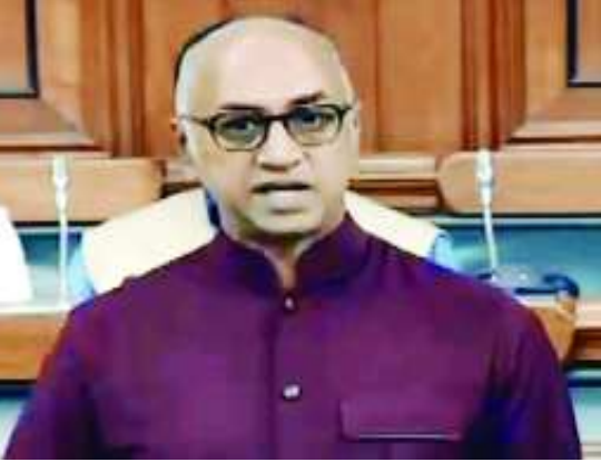
అదేనా సభా వికాస?

దిల్లీ: గత ఐదేళ్లలో ఏపీకి ప్రత్యేక హోదా సాధనకు తెదేపా ఎంతగానో పోరాడిందని ఆ పార్టీ ఎంపీ గల్లా జయదేవ్ అన్నారు. లోక్సభలో రాష్ట్రపతి ప్రసంగానికి ధన్యవాదాలు తెలిపే తీర్మానంపై ఆయన మాట్లాడారు. హోదాపై మాట తప్పినందుకే రాష్ట్రంలో భాజపా చిరునామా గల్లంతైందన్నారు. తెదేపా ప్రత్యేకహోదా సాధించలేదని భావించిన ప్రజలు.. వైకాపాకు ఒక్క అవకాశం ఇవ్వాలని చెప్పారు.