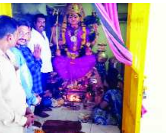
మూడవరోజు ఆంగరంగం వైభవంగా మేళతాళాలతో పురవీధుల్లో ఊరేగిస్తూ అమ్మ వారిని అనుభవ కార్యక్రమాన్ని చేపడతామని ఆలయ అన్నారారు ఈ కార్యక్రమంలో ఆలయ కమిటీ సభ్యులు మరియు అధిక సంఖ్యలో భక్తులు పాల్గొన్నారు