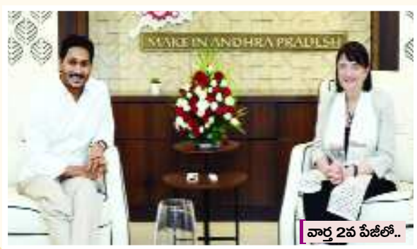
వార్త 2వ పేజీలో..