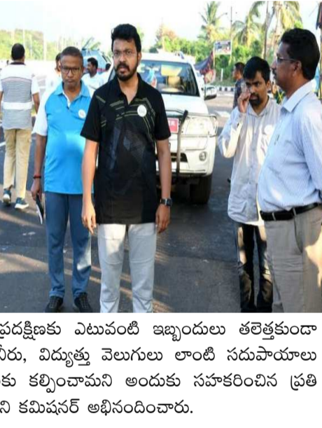
గిరి ప్రదక్షిణకు ఎటువంటి ఇబ్బందులు తలెత్తకుండా తాగునీరు, విద్యుత్తు వెలుగులు లాంటి సదుపాయాలు భక్తులకు కల్పించామని అందుకు సహకరించిన ప్రతి ఒక్కరిని కమిషనర్ అభినందించారు.