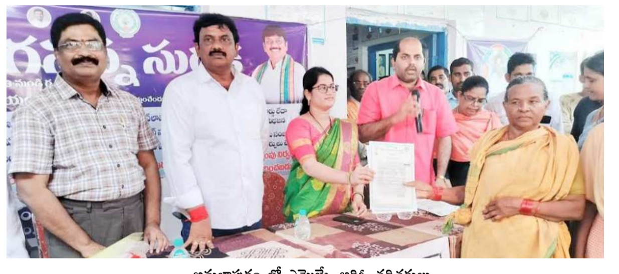
అమలాపురం లో ఎమ్మెల్యే ఆర్డీఓ తదితరులు...