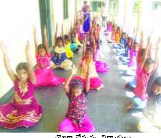
యోగా చేస్తున్న విద్యార్థులు