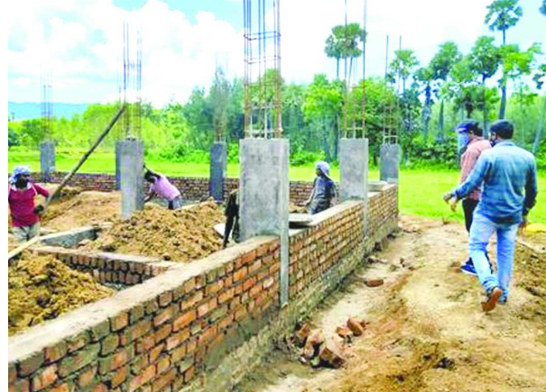
సచివాలయ నిర్మాణాల పనులు పరిశీలిస్తున్న దృశ్యం

గొలుగొండ : గొలుగొండ మండలం చీడిగుమ్మల-2 గ్రామ సచివాలయం భవన నిర్మాణం పనులను గురువారం ఈజిఆర్డి లాలం సీతయ్యనాయుడు బుధవారం పరిశీలించారు. ఈ సందర్భంగా ఆయన మాట్లాడుతూ పనుల్లో నాణ్యత లోపిస్తే సహించేది లేదన్నారు. సకాలంలో పనులు పూర్తి చేసి తమకు అప్పగించాలన్నారు. అనంతరం గ్రామ సచివాలయాన్ని తనిఖీ చేసి రికార్డులను పరిశీలించారు. సచివాలయం నిర్మాణ వాలంటీర్లు గ్రామంలో సమన్వయం గుర్తించడంతో పాటు వాటి పరిష్కారానికి కూడా చర్యలు తీసుకోవాలన్నారు. ప్రజలకు నిరంతరం సిబ్బంది అందుబాటులో ఉండాలన్నారు.