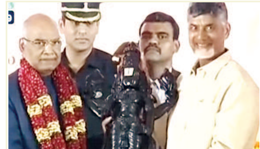
తన రెండో పర్యటననే తరువాయి 2లో

రాష్ట్రపతికి ఘన పౌర సన్మానం రాష్ట్ర ప్రభుత్వం తరఫున రాష్ట్రపతి రామ్ నాథ్ కోవింద్ ను ఘనంగా సత్కరిం