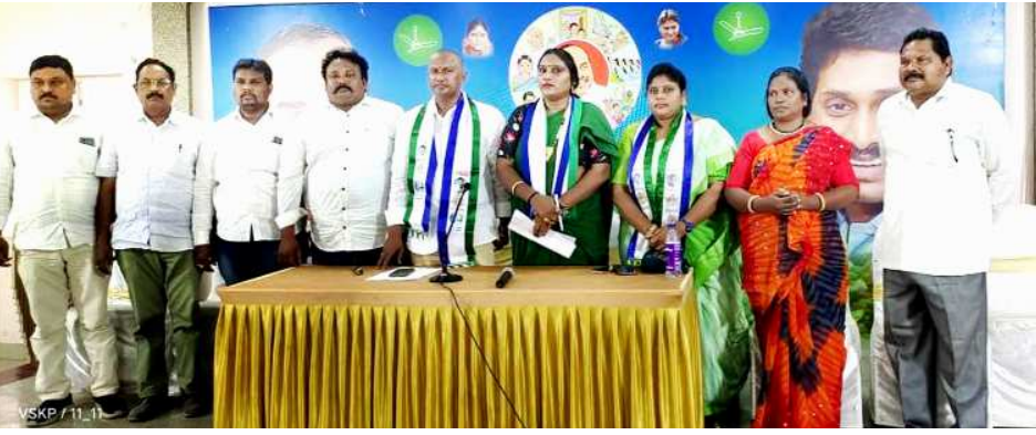
అందరూ ముంచేస్తారు.. ఆ తర్వాత బాధపడి ప్రయోజనం ఉండదు. ముందే మేలుకో.