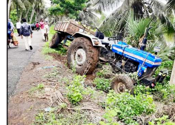
కాట్రేనికొన (విజయభాను న్యూస్) : మండలం కాట్రేనికొన కుండలేళ్ళరం ఆరంభిద్ద రోడ్డుపై తామర చెరువు సమీపంలో ఒక ట్రాక్టర్ అదుపుతప్పి కాలువ పైపు దూసుకుపోయే కఠింబు స్తంభాన్ని ఢీ కొట్టింది. కొబ్బరికాయలు లోడ్ తో కుండలేళ్ళరం నుండి కాట్రేనికొన వైపు వస్తుండగా ఈ ప్రమాదం చోటు చేసుకుంది ప్రమాద సమయంలో డ్రైవర్ తో పాటు ట్రాక్టర్లో ఉన్నవారు క్రిందికి దూకేయడంతో పెను ప్రమాదం తప్పించి బాదితులు తెలిపారు.