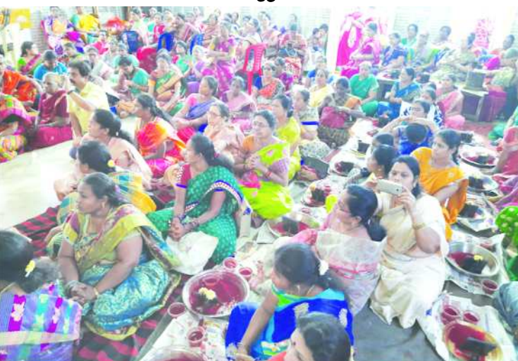
అమ్మవారి కోటి కుంకుమార్చనలో పాల్గొన్న మహిళలు