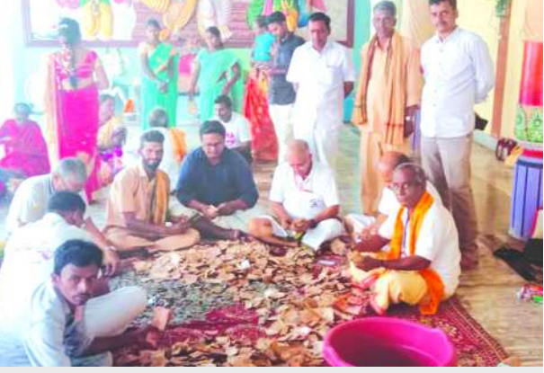
హుండ్లీ ఆదాయం లెక్కిస్తున్న అధికారులు