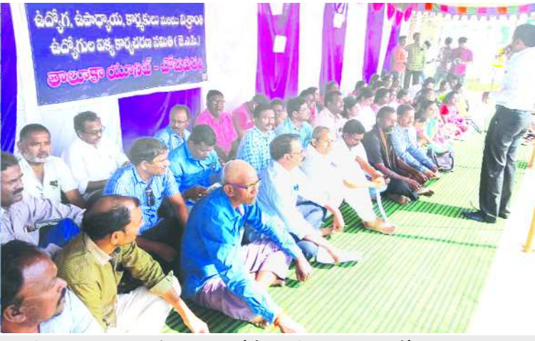
చోడవరంలో ధర్మా చేపడుతున్న ఏపీ ఉద్యోగ సంఘాల జేపిసి నాయకులు

చోడవరం : దీర్ఘకాలికంగా ఉన్న పలు సమస్యలను ప్రభుత్వం తక్షణం పరిష్కరించాలని కోరుతూ ఉద్యోగ, ఉపాధ్యాయ, కార్మిక, పెన్షనర్ల సంఘాల ఐక్య కార్యచరణ సమితి అధ్యక్షులలో శుక్రవారం ధర్మా నిర్వహించారు. ఏ.పి.జె.వి.సి రాష్ట్ర సంఘం పిలుపు మేరకు స్థానిక తహసీల్దారు కార్యాలయం గేటు వద్ద తమ సమస్యలు పరిష్కరించాలంటూ వివిధ నినాదాలు చేస్తూ నిరసన తెలిపారు. ముఖ్యంగా 11వ పి.ఆర్.సి 17,18 నుండి అమలు చేయాలని, 3వ విడత డి.వి మంజూరు, సి.పి.ఎన్. రద్దు, కాంట్రాక్టు ఉద్యోగుల క్రమబద్ధీ కరణ, పాఠశాలలో తెలుగు మాధ్యమం కొనసాగించాలని, అలాగే రాష్ట్ర ప్రభుత్వ ఉద్యోగులకు హెల్త్ కార్యలు ధ్వారా వైద్యం అందేలా చూడాలని ప్రభుత్వాన్ని డిమాండ్ చేశారు.