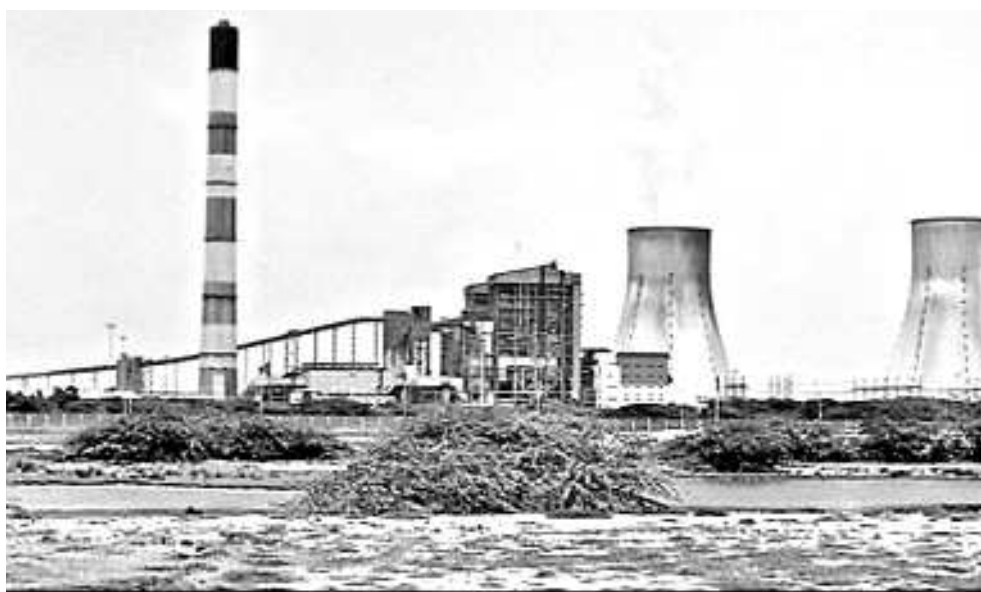
రవాణా కావాల్సిందే. దీనికి మాత్రం ఒడిపోలోని తాల్చేరు నుంచి పారాద్వీప పోర్టుకు అక్కడి నుంచి నౌకల ద్వారా కచ్చితమైన పట్టుంట్లను ఓడరేవుకు చేరుతుంది. కన్వేయరు గెలుసు ద్వారా జెన్కోకు రవాణా కావడంతో వ్యయభారం కూడా తగ్గుతుంది.

ముత్తుకూరు : రాష్ట్రంలో విద్యుత్తు రంగం ఎంతో అభివృద్ధి సాధించింది. లోటు నుంచి మిగులులోకి చేరుకుని తాప విద్యుత్తు కేంద్రాలు ఉత్పత్తిని తాత్కాలికంగా నిలిపివేసి స్థితికి చేరాయి. ప్రభుత్వ రంగ సంస్థ అయిన ఏటీఎస్ కో ముత్తుకూరు మండలంలోని నెలటూరులో 1600 మెగావాట్లతో రెండు యూనిట్లు నెలకొల్పింది. రెండో దశలో రూ.4276 కోట్లతో మూడో యూనిట్ పనులు ముమ్మరంగా సాగుతున్నాయి. దేశంలోనే సూపర్ గ్రేటికల్ పరిష్కారంతో ఏర్పాటైన తొలి థర్మల్ కేంద్రంగా ఇది పేరుపొందింది. ప్రస్తుతం డిమాండ్ లేకపోవడంతో విద్యుదుత్పత్తిని నిలిపేశారు. నెల్లూరు, చిత్తూరు జిల్లాలో రానున్న పరిశ్రమల కోసం మూడో యూనిట్ నుంచి వచ్చే 800 మెగావాట్లు కీలకం కానుంది.