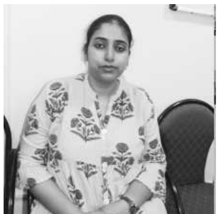
పూర్తిస్థాయిలో నియంత్రించడానికి చర్యలు తీసుకుంటామన్నారు. వరాకాలంలో ముందస్తు చర్యల్లో భాగంగా దోమల నియంత్రణకు ప్రణాళికలను అమలు చేస్తామన్నారు.

విజయనగరం : విజయనగరం పురపాలక ప్రజాకోగ్య అధికారిణిగా డా.బి.ప్రణీత నియమితులయ్యారు. సాలూరు మండలం తోటా ప్రాథమిక ఆరోగ్య కేంద్రంలో పనిచేస్తున్న ఆమెను డిప్యూటీ సెన్సిటివ్ పురపాలక సంఘంలో ఎంపావడిగా నియమించారు. సోమవారం ఆమె పూర్తిస్థాయిలో బాధ్యతలు స్వీకరించారు. ఈ సందర్భంగా ఆమె విలేజ్ లులలో మాట్లాడుతూ ప్రజాప్రతినిధులు, ఉన్నతాధి కారులు, ప్రజల సహకారంతో పట్టణంలో పారిశుధ్యం మెరుగుదలకు చిత్తశుద్ధితో కృషి చేస్తామన్నారు. పట్టణంలో పరిసరాల పరిశుభ్రతపై ప్రజలకు అవగాహన కార్యక్రమాల ద్వారా చైతన్యం కల్పించడానికి చర్యలు తీసుకుంటామన్నారు. అలాగే ప్లాస్టిక్ వాడకుండా వల్ల కలిగే అనర్థాలను ప్రజలకు వివరించి పట్టణంలో ప్లాస్టిక్ ను