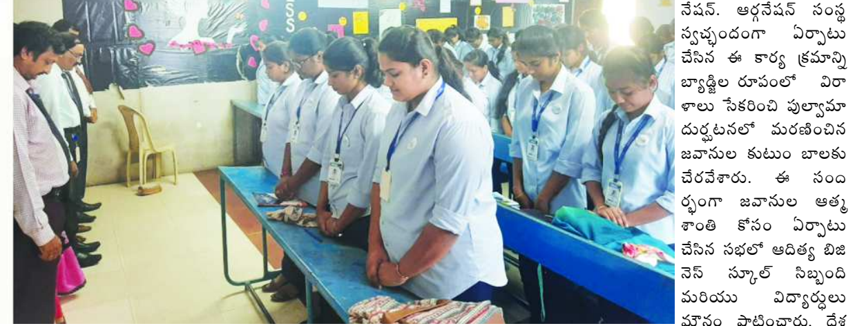
విశాఖపట్నం : పుల్గామా ఘటన స్మృత్యర్థం దేశం మొత్తం 3.15 ని:లకు ఒక నిమిషం పాటు మౌనం పాటించారు. ఐ స్టాండ్ ఫర్ ది నేషన్. ఆర్గనైజర్ల సంస్థ స్వచ్ఛందంగా ఏర్పాటు చేసిన ఈ కార్యక్రమాన్ని బ్యాండ్ల రూపంలో విశాఖలు సేకరించి పుల్గామా దుర్ఘటనలో మరణించిన జవానుల కుటుంబాలకు చేరవేశారు. ఈ సంఘం జవానుల అత్యుత్తమ శ్రమలకు ఏర్పాటు చేసిన సభలో ఆదిత్య బిజినెస్ స్కూల్ నిబ్బంది మరియు విద్యార్థులు మౌనం పాటించారు. దేశ