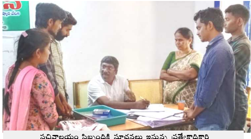
సచివాలయం సిబ్బందికి సూచనలు ఇస్తున్న ప్రత్యేకాధికారి