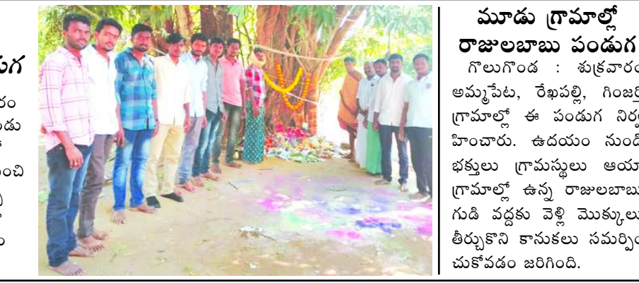
మాడు గ్రామాల్లో రాజులబాబు పండుగ గొలుగండ : శుక్రవారం అమ్మపేట, రేఖపల్లి, గింజర్తి గ్రామాల్లో ఈ పండుగ నిర్వహించారు. ఉడయం నుండి భక్తులు గ్రామస్థులు ఆయా గ్రామాల్లో ఉన్న రాజులబాబు గుడి వద్దకు వెళ్లి మొక్కులు తీర్చుకొని కానుకలు సమర్పించుకోవడం జరిగింది.

భక్తి శ్రద్ధలతో ఆదవిరాజులబాబు పండుగ నాతవరం : శుక్రవారం నాతవరం గ్రామంలో ఆదవిరాజులబాబు పండుగను గ్రామస్థులు భక్తి శ్రద్ధలతో జరుపు కున్నారు. వేకువజాము నుంచి భక్తులు వచ్చి మొక్కులు తీర్చుకున్నారు. పండుగ సందర్భంగా గ్రామంలో సందడి వాతావరణం నెలకొంది.