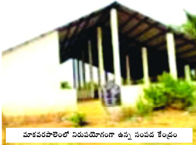
మాకవరపాలెంలో నిరుపయోగంగా ఉన్న సంపద కేంద్రం

మాకవరపాలెం : పల్లెలను చెత్త రహితంగా తీర్చిదిద్ది, తద్వారా గ్రామంలోనే అన్నదాతలకు సెంద్రియ ఎరువులం దించాలన్న సంకల్పంతో టీడీపీ ప్రభుత్వ హయాంలో నిర్మాణమైన సంపద కేంద్రాలు నేడు వృధాగా పడివున్నాయి. దీంతో గ్రామాల్లో ఎక్కడికక్కడ చెత్త దర్శన మిస్తోంది. చాలా చోట్ల చెత్తను రోడ్లపైన పారబోస్తుండటంతో జనం తీవ్ర ఇబ్బందులు ఎదుర్కొంటున్నారు. గత టీడీపీ ప్రభుత్వ హయాంలో మండలంలోని 18 గ్రామాల్లో సంపద కేంద్రాలను నిర్మించారు. ఇందులో తామరం ఒక్కటే పని చేస్తోంది. మిగిలిన గ్రామాల్లోని సంపద కేంద్రాల్లో వానపాములను విడుదల చేసి నిరుపయోగంగా వదిలివేశారు. మాకవర పాలెంలో ఇప్పటికే పూర్తిగా చెత్త పారబోయడంతో సవిత్ర గెడ్డ పూర్తిగా చెత్తతో పూడుకుపోయింది. ఇక్కడ నిత్యం చెత్తను వేస్తూ నిప్పు పెడు తుండటంతో పొగ వల్ల అటుగా వెళ్లేవారు ఉక్కిరిబిక్కిర వుతున్నారు.