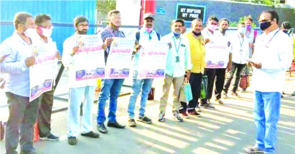
ములగాడ: ప్రజావ్యతిరేక విధానాలు అవలంబిస్తున్న ప్రధాని మోడీకి ప్రజలు, కార్మికులు బుద్ధి చెప్పే రోజులు దగ్గర్లోనే ఉన్నాయని షివ్ యార్డ్ గుర్తింపు యూనియన్ ప్రతినిధులు ఉద్యమిస్తామని హెచ్చరించారు. ఈ కార్యక్రమంలో కార్మిక్ సంఘాల నాయకులు, ఉద్యోగులు తదితరులు పాల్గొన్నారు.