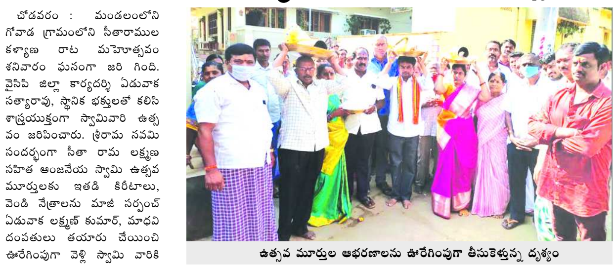
ఉత్సవ మూర్తుల ఆభరణాలను ఊరేగింపుగా తీసుకెళ్తున్న దృశ్యం