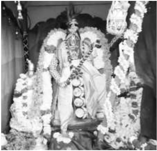
సింహాచలం: సింహాద్రి శ్రీ సింహాద్రి అప్పన్న ఆలయంలో కృష్ణాష్టమి వేడుకల్లో భాగంగా ఉట్టసంభరం వేడుక కడు రమ్యంగా