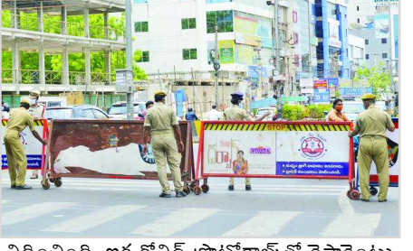
విధించింది. ఇక కోవిడ్ ప్రాటోకాల్స్ తో రెస్టారెంట్లు, జిమ్స్, కల్యాణ మండపాలకు అనుమతినిచ్చిన ప్రభుత్వం.. శానిటైజర్, మాస్క్ ధరించడం, భౌతికదూరం పాటించడం తప్పని సరి అని సుసందర్భాటించింది.

అమరావతి: ఆంధ్రప్రదేశ్ ప్రభుత్వం కర్ఫ్యూ సడలింపుల్లో పలు మార్పులు ప్రకటించింది. తాజా నిబంధనల ప్రకారం.. ఉభయ గోదావరి జిల్లాల్లో ఉదయం 6 నుంచి రాత్రి 7 వరకు సడలింపు ఉంటుంది. సాయంత్రం 6 గంటలకే దుకాణాలు మూసివేయాల్సి ఉంటుంది. ఇక మిగిలిన 11 జిల్లాల్లో ఉదయం 6 నుంచి రాత్రి 10 వరకు సడలింపునిచ్చిన ప్రభుత్వం.. ఆయాచోట్ల రాత్రి 9 గంటలకే దుకాణాలు మూసివేయాలని స్పష్టం చేసింది.