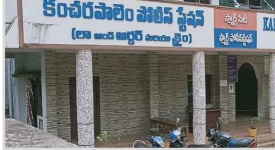
కంచరపాలెం పోలీస్ స్టేషన్