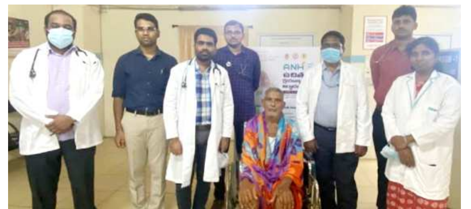
రోగిని బ్రతికించారు అనీల్ నీరుకొండ ఆసుపత్రి ఎమర్జెన్సీ కేర్, వైద్య బృందం, నర్సింగ్ కేర్ ఉన్నత ట్రీట్మెంట్, సేవ అందించి రోగి పరిస్థితిని మెరుగుపరిచి డిస్చార్జ్ చేశారు.