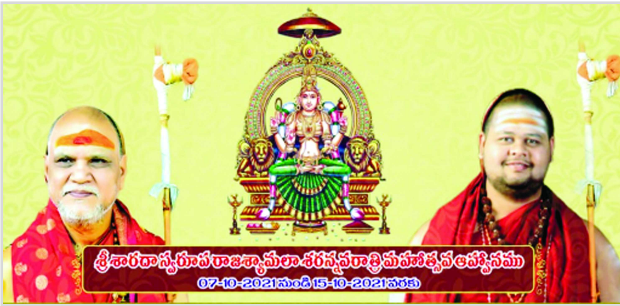
శ్రీ శారదాస్వరూప రాజశ్యామలా శరన్నవరాత్రి మహాత్మ్యవ ఆంక్షనము 07-10-2021 నుండి 15-10-2021 వరకు