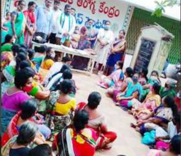
విశాఖపట్నం : 75 సం||లలో ఏ రాష్ట్ర ముఖ్యమంత్రి మహిళలు కళ్ళలో ఆనందం కోసం పని చేయలేకపోయారు కాని మన ముఖ్యమంత్రి వైఎస్.జగన్ మోహన్ రెడ్డి ఆ పని సాకారం చేసేందుకు శ్రీకారం చుట్టారు. రాష్ట్రంలో మహిళలు ఆర్థికంగా అభివృద్ధి చెందాలని, మనస్ఫూర్తిగా ఇంటి ఇంటి కి సంక్షేమం

కోసం ఏపీ ప్రభుత్వం ప్రవేశపెట్టిన గొప్ప సంక్షేమ పథకం వైఎస్ఆర్ ఆసరా 0 వడ్డీ కే రుణాలు, ఇంటి పద్ద కే ప్రభుత్వ సంక్షేమ పథకాలు అందేలా చేశారు. ఇచ్చిన మాట ప్రకారం ఎంత మంది విమర్శలు చేసిన గ్రామ స్వరాజ్యం లో భాగంగా గ్రామ సచివాలయం లో ప్రత్యేక ప్రభుత్వ సేవలు ప్రారంభించారు. ఆయన మాట్లాడుతూ వైఎస్ఆర్ ఆసరా, జగన్ అన్న చేయూత, జగన్ అన్న తోడు, వాహన మిత్ర, జగన్ అన్న విద్యా దీవెన, అమ్మ ఒడి ఇలా సంక్షేమ పథకాలు అన్ని సకాలంలో అందుతున్నాయని లేదా అని ఆడిగి మరీ తెలుసుకున్నారు.