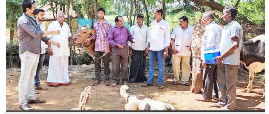
కందిపల్లి లో పశు వైద్య శిబిరం నిర్వహిస్తున్న పశు వైద్యులు