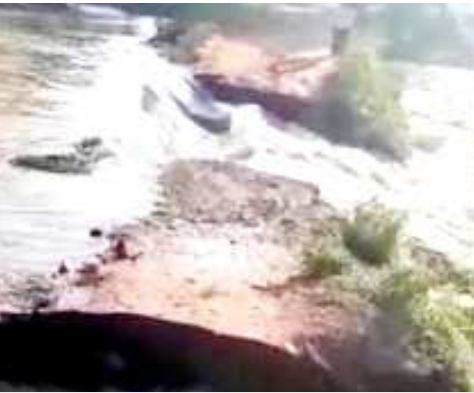
వరదనీటి ఉద్ధతికి కొట్టుకుపోయిన గవరవరం శారదా నది పై వేసిన తాత్కాలిక వంతెన

- మాడు మండలాల ప్రజల రాకపోకలకు తీవ్ర ఇబ్బందులు చోడవరం:- మండలంలోని గవరవరం గ్రామంలో శారదానది ఉద్ధతికి తాత్కాలికంగా ఏర్పాటు చేసిన వంతెన సోమవారం అర్ధరాత్రి నీటి ప్రవాహంలో కొట్టుకుపోయింది. గత ఆరేళ్ల క్రితం గవరవరం వంతెన కూలిపోవడంతో, కొత్త వంతెన నిర్మాణం పూర్తయ్యేంత వరకు వాహనాల రాకపోకలకు తాత్కాలిక వంతెనను ఏర్పాటు చేశారు. అయితే ఇటీవల కురిసిన భారీ వర్షాలతో నీటి ఉద్ధతి పెరిగి తాత్కాలిక వంతెన కొట్టుకు పోయింది. దీంతో చోడవరం, దేవరాపల్లి, కే కట్టపాడు మండలాలలో ప్రజల వాహనాల రాకపోకలకు తీవ్ర అంతరాయం ఏర్పడింది. ప్రభుత్వం కల్పించుకొని నూతన వంతెన నిర్మాణం వేగవంతం చేసి ప్రారంభించాలని పరిసర గ్రామాల ప్రజలు కోరుతున్నారు.