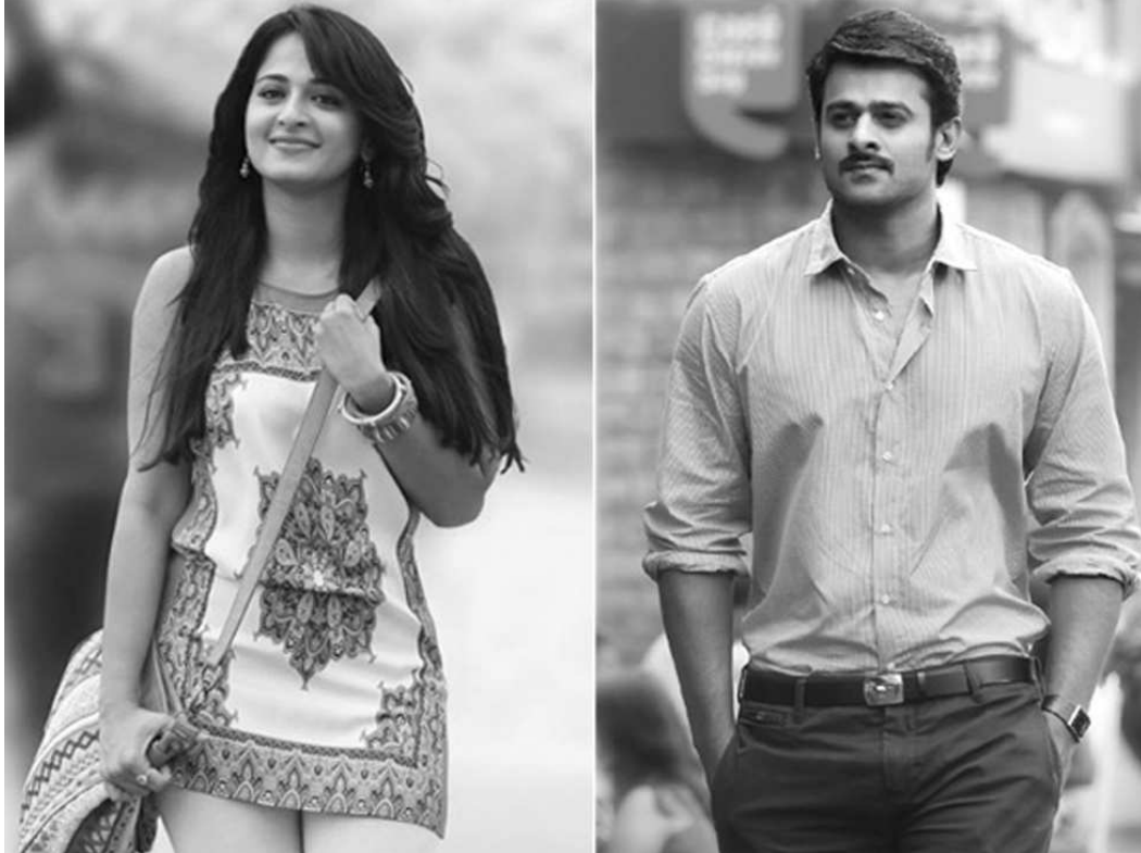
ప్రభాస్ ప్రస్తుతం సాహో సినిమాలో నటిస్తున్న సంగతి తెలిసిందే. సుజీత్ దర్శకత్వం వహిస్తున్న ఈ చిత్రంలో బాలీవుడ్ నటి శ్రద్ధా కపూర్ కథానాయిక పాత్ర పోషిస్తున్నారు.

విభిన్నమైన చిత్రాలతో.. కొత్తగా ప్రయత్నించడంలో కథానాయిక అనుష్క ఎప్పుడూ ముందు ఉంటారని కథానాయకుడు ప్రభాస్ అన్నారు. అనుష్క టెలివిజన్ రోల్స్ నటించిన చిత్రం భాగమతి. అశోక్ దర్శకత్వం వహిస్తున్నారు. ఈ చిత్రం టీజర్ ముంగళవారం విడుదల చేశారు. దీన్ని ప్రభాస్ ఫేసిబుక్ వేదికగా అభిమానులతో పంచుకున్నారు. అనుష్క కథల ఎంపికను మెచ్చుకున్నారు.