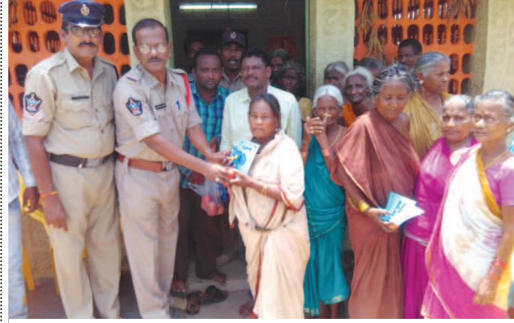
వృద్ధులకు పళ్ళ పంచుతున్న సిఐ