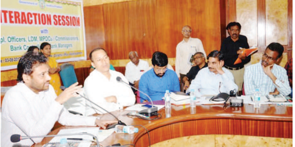
విశాఖపట్నం: రాష్ట్ర ప్రభుత్వం నిరుపేదల దిగా ఆంధ్రప్రదేశ్ షెడ్యూల్డ్ కులాల సహకార ఆర్థిక అభ్యున్నతికి అనేక సంక్షేమ పథకాలను అందజేస్తున్నదని వాటిని సక్రమంగా అమలు పర్చాలని విజయకుమార్ జి. శ్రీకర్ తరువాయి 2లో