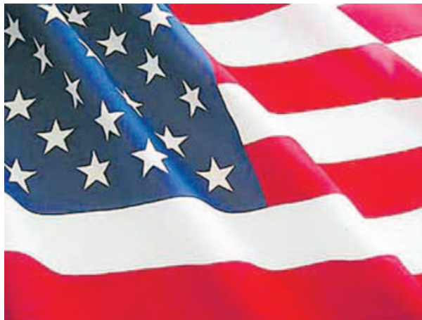
వాషింగ్టన్: అమెరికాలోని ఔట్సోర్సింగ్ కంపెనీలు హెచ్1బీ, ఎల్1 వీసాలను దుర్బిని యోగం చేయకుండా

అడ్డుకోవాలని ఆ దేశ చట్టసభల ప్రతినిధుల బృందం అధ్యక్షుడు డొనాల్డ్ ట్రంప్ను కోరింది. ఈ మేరకు కాంగ్రెస్ సభ్యుల బృందం ట్రంప్కు లేఖ రాసింది. ఔట్సోర్సింగ్ సంస్థలు స్థానికులకు బదులుగా విదేశీ ఉద్యోగులను చేకగా అమెరికాకు తరలిస్తున్నాయని ఆరోపించింది. అమెరికన్ ప్రయోజనాలను రక్షించేందుకు బిల్లును ప్రవేశపెట్టినట్లు పేర్కొంది. ఉద్యోగాల భర్తీ సమయంలో స్థానికులకే ప్రాధాన్యమివ్వడంతోపాటు అమెరికన్లను ఉద్యోగాల నుంచి తొలగించి మరొకరికి కట్టబెట్టడాన్ని ఈ బిల్లు నిషేధిస్తుందని తెలిపింది. 50 మంది కంటే ఎక్కువ ఉద్యోగులున్న అమెరికన్ ఔట్సోర్సింగ్ సంస్థల్లో 50% కంటే ఎక్కువ మంది హెచ్1బీ, ఎల్1 ఉద్యోగు లుంటే కొత్తగా విదేశీయులను నియమించు కోవడాన్ని ఈ బిల్లు నిషేధిస్తుందని వెల్లడించింది.