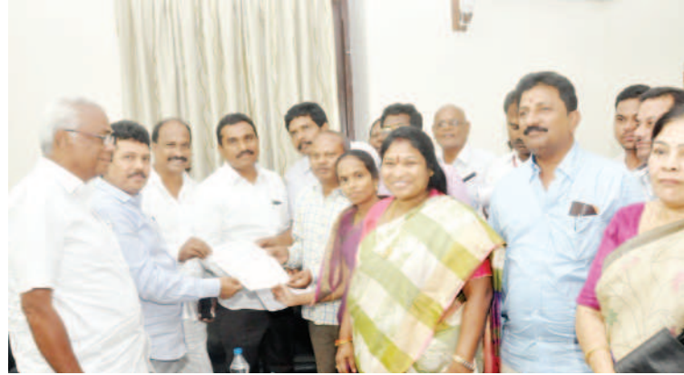
విశాఖపట్నం: గిరిజన వినతుల సత్వర పరిష్కారానికి చర్యలు మెరుగుపై ప్రభుత్వం ప్రత్యేక దృష్టి సారించిందన్నారు. గిరిజనుల చేపడతామని రాష్ట్ర శాసనసభా గిరిజన సంక్షేమ కమిటీ అధ్యక్షుడు సంక్షేమాన్ని కాంక్షిస్తూ రాష్ట్ర ప్రభుత్వం పలు తరువాయి 2లో