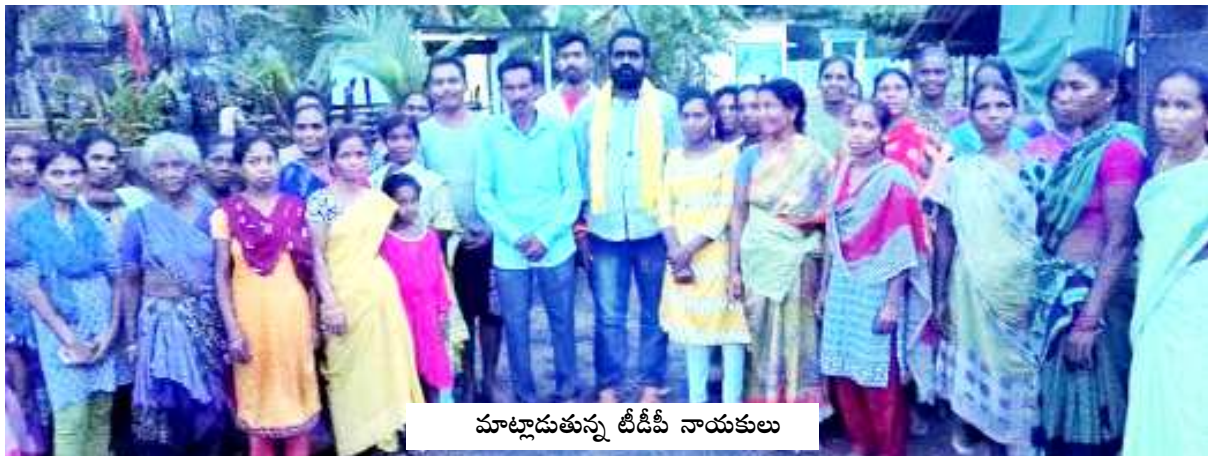
మాట్లాడుతున్న టీడీపీ నాయకులు