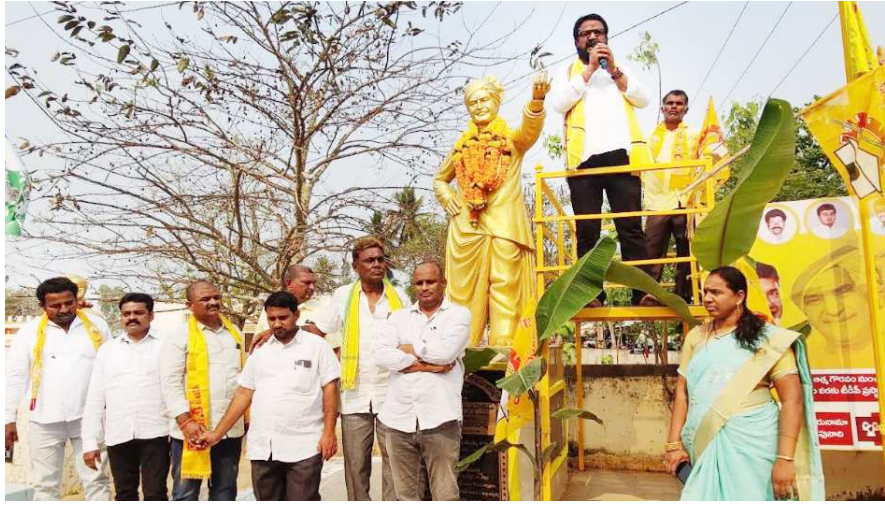
ఎన్టీఆర్ విగ్రహానికి నివాళులు అర్పిస్తున్న దుక్కలం

మాకవరపాలెం (విజయభాను న్యూస్) : మాకవరపాలెం మండలంలోని పలు గ్రామాల్లో మంగళవారం తెలుగుదేశం పార్టీ ఆవిర్భావ దినోత్సవ వేడుకలు ఆ పార్టీ నాయకులు, కార్యకర్తలు అత్యంత ఘనంగా జరుపుకున్నారు. ప్రతీ గ్రామంలో ఉన్న ఎన్టీఆర్ విగ్రహానికి పూలమాలలు వేసి