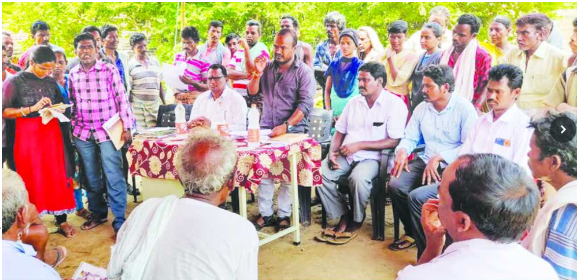
భీంపాళు గ్రామ పంచాయతీ గ్రామసభకు హాజరైన ప్రజలు, అధికారులు

అనంతగిరి : అనంతగిరి మండల లంలో గల భీమపాళు, టోకురు, గురుగుబిల్లి లో మహాత్మా గాంధీ జాతీయ గ్రామీణ ఉపాధి హామీ పథకం పనులు, నిమిత్తం గ్రామ సభలు నిర్వహించడం జరిగింది. భీంపాళు, పంచాయతీ కార్యాలయం వద్ద శుక్రవారం మహాత్మా గాంధీ జాతీయ ఉపాధి హామీ పథకం గురించి గ్రామ సభ నిర్వహించడం జరిగింది ఈ సభలో టీ.డి.బూరు సింహాచలం మాట్లాడుతూ ముందస్తు ప్రణాళికతో ప్రభుత్వం ముందు కు వెలుతుందని ఇదివరకు ఏ సంవత్సరమునకు ఆ సంవత్సరము ఉపాధి హామీ పనుల నిమిత్తం గ్రామసభ నిర్వహించి తీర్మానం చేయడం జరిగేదని కానీ ఇప్పుడు అలా కాకుండా ఒకసారి తీర్మానం చేసి మూడు సంవత్సరాలకు సరిపడా పనులు తెలపాలని భూమి చదును చేయడం కాలువలు తీసుకోవటం ప్రజలకు ఏ పనులు కావాలన్నా ఆ పనులు గ్రామ సభ ద్వారా తీర్మానం చేయడం జరుగుతుందని, ప్రజలకు అవసరమైన పనులు తెలపాలని, ఆయన తెలపడం జరిగింది పంచాయతీలో గత సంవత్సరం లో 1076 మంది కూలీలు ఉన్నారని అందులో