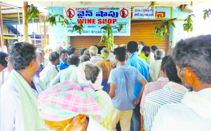
చూశారు. మద్యం కోసం వందల సంఖ్యలో భారులు తీరిన దృశ్యం అందర్నీ ఆశ్చర్య పరిచింది.

గతంలో ఔట్ షాపులు ఉండడంతో మందుబాబులకు మద్యం అందుబాటులో ఉండేది. ప్రస్తుతం ప్రభుత్వం మారి ఔట్ షాపులు ఎత్తివేయడంతో పాటు ఉన్న వైస్ షాప్ ఉదయం 11 గంటలకు తెర వాలని నిబంధన ఉండడంతో మందుబాబులు ఉపిరి బిగబట్టి షాప్ తెరిసేంత వరకు ఎదురు