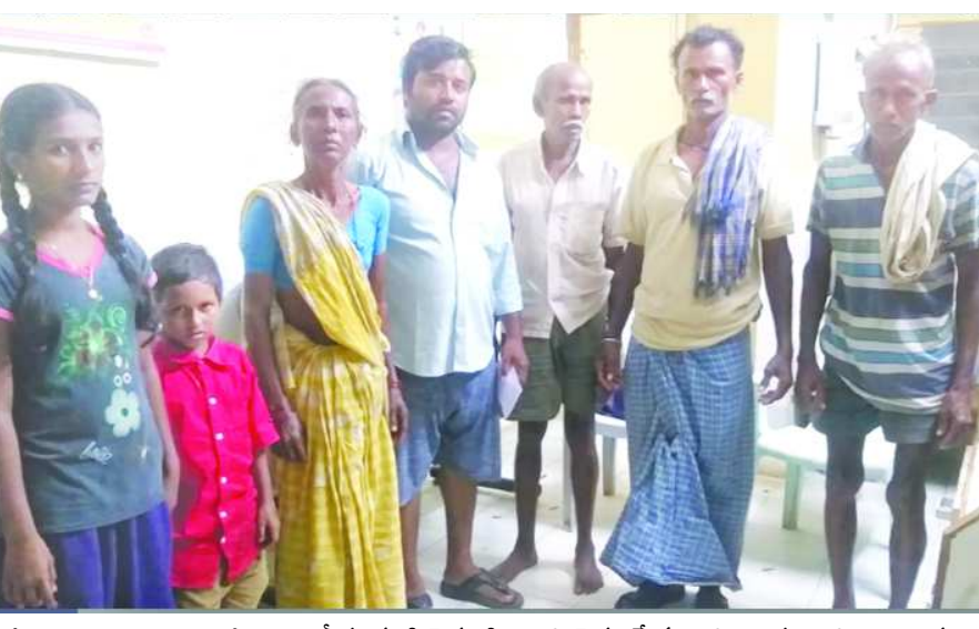
వీరందరికీ వైద్య సిబ్బంది వైద్య సేవలందించారు. ఇదిలా ఉండగా గ్రామాల్లో విచ్చలవిడిగా తిరుగుతూ ప్రజల ప్రాణాలతో చెలగాటం ఆడుతున్న కుక్కలను నివారించాలని ప్రజలు కోరుతున్నారు.