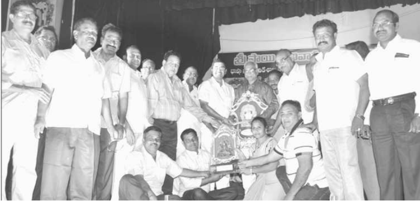
ఉత్తమ ప్రదర్శనగా రూ. 15 వేలు నగదు పారితోషికం, రోలింగ్ షిట్ల, జ్ఞాపిక గెల్చుకున్న 'ద్రౌపదీ స్వయంవరం' బృందం

- ముగిసిన పెతకంశెట్టి అప్పల నరసింహం స్మారక పౌరాణిక పద్య నాటక పోటీ