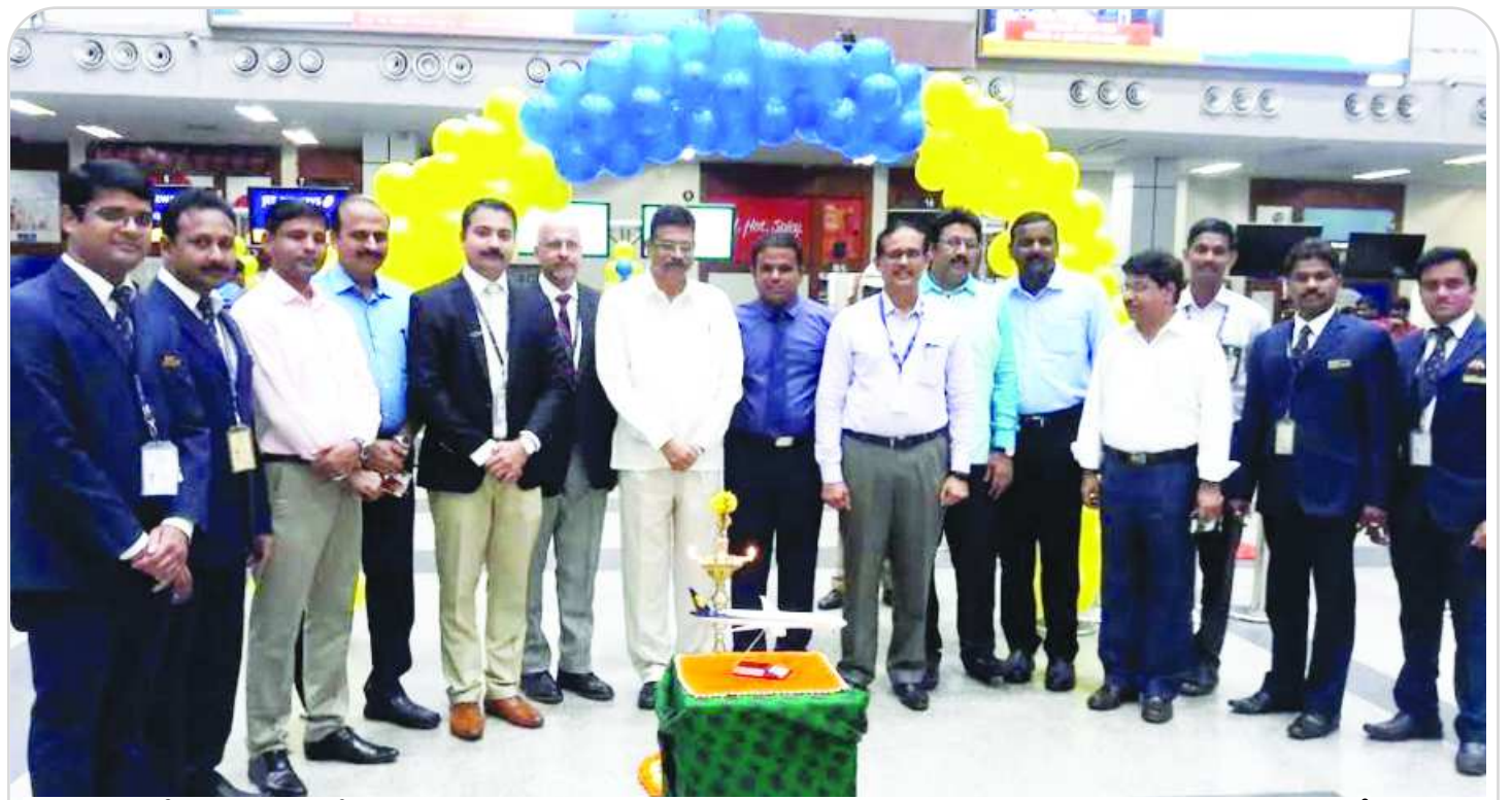
డిల్లీకి జేబ్ ఎయిర్ వేసిన ప్రారంభించిన విశాఖ పార్లమెంటు సభ్యుడు కంభంపాటి హరిబాబు. ఈ విమానం విశాఖపట్నంలో ఉదయం 10.25కు బయలుదేరి మధ్యాహ్నం 12.15 గంటలకు డిల్లీకి చేరుకుంటుందని సిబ్బంది తెలిపారు.