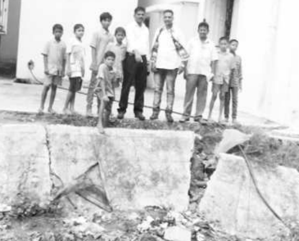
డార్మటరీ వెనకే బహిరంగ మలవిసర్జన చూపుతున్న దృశ్యం

నెలల తరబడి జామ్ అయిన మరుగుదొడ్డు హాస్టల్ వెనుకే బహిరంగ మలవిసర్జన ఆరు గదులకు అందని వాటర్ సరఫరా కంపుకొడుతున్న డార్మటరీ