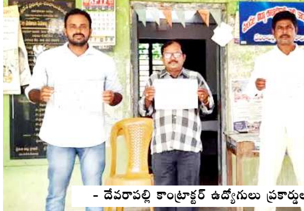
దేవరాపల్లి కాంట్రాక్టర్ ఉద్యోగులు ప్రకాశం ప్రదర్శన

దేవరాపల్లి : కాంట్రాక్టర్ అవుట్ సోల్సింగ్ ఉద్యోగులకు మినిమం టైం స్కేల్ ఇవ్వాలని విశాఖ మహా నగరంలో ఆదివారం జరుగు పథకం విజయవంతం చేయాలని శనివారం మండలంలో పనిచేస్తున్న సి ఆర్ పి ఎస్, డేటా ఎంప్లీ ఆపరేటర్, అకౌంటెంట్, మెసేజెస్ అందరూ కలిసి సమగ్ర శిక్షణ లో పనిచేస్తున్న కాంట్రాక్టు ఉద్యోగులంతా ఆదివారం జరిగే సభను విజయవంతం చేయాలని వారు ప్రకారం లతో పిలుపునిచ్చారు.