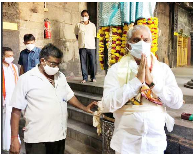
నేవీ వెటరన్స్ బృంద సభ్యులు తదితరులు దర్శించుకున్నారు. సింహగిరి కి చేరుకున్న వీరికి ఆలయ అధికారులు సాదర స్వాగతం పలుకగా ఆలయంలో పూజలు ఆనంతరం... కస్తుంబ అలింగనం లక్ష్మీ అమ్మవారి ఆలయంలో పూజలు