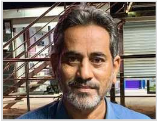
కంచరపాలెం : షియా ముస్లిం బరేల్ గ్రాండ్ త్వలితగతిన కేటాయింపింది కేటాయింపింది కేటాయింపింది