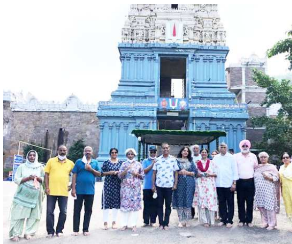
నిర్వహించారు బేదా మండపంలో వీరికి వైధి కులువేద ఆశీర్వాదనం పలుకగా... అధికారులు వీరికి స్వామివారి చిత్రపటం తీర్థ ప్రసాదాలు అందజేశారు.