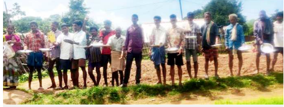
అన్నం తినే కంచాలు పట్టుకొని ధర్నా చేస్తున్న ఉపాధి హామీ కూలీలు

అనంతగిరి (విజయభాను న్యూస్): గత సంవత్సరం నుండి ఉపాధి హామీ బకాయిలు చెల్లించండి. ఆర్ ఓ ఎఫ్ ఆర్, పట్టాలకు రైతు భరోసా ఇప్పించాలని కోరుతూ. అన్నం తినే కంచాలు చేతపట్టి భిక్షాటన చేస్తూ, దర్జా నిర్వహించడం జరిగింది. అల్లూరి సీతారామరాజు జిల్లా అనంతగిరి మండలం రొంపల్లి పంచాయతీ బూరుగ, చిన కోనేల, ఆదివాసీ గిరిజనులు