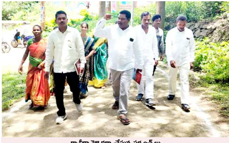
ర్యాలిగా వెళ్ల ధర్మా చేస్తున్న సర్పంచ్ లు