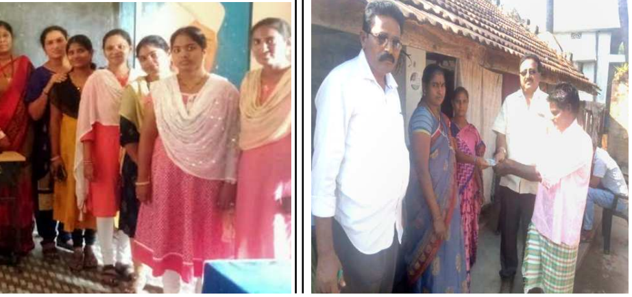
అమృతాపురంలో సావిత్రి భాయి పూలే జయంతి