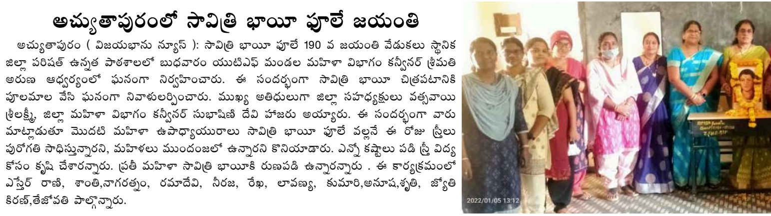
అమృతాపురంలో సావిత్రి భాయి పూలే జయంతి