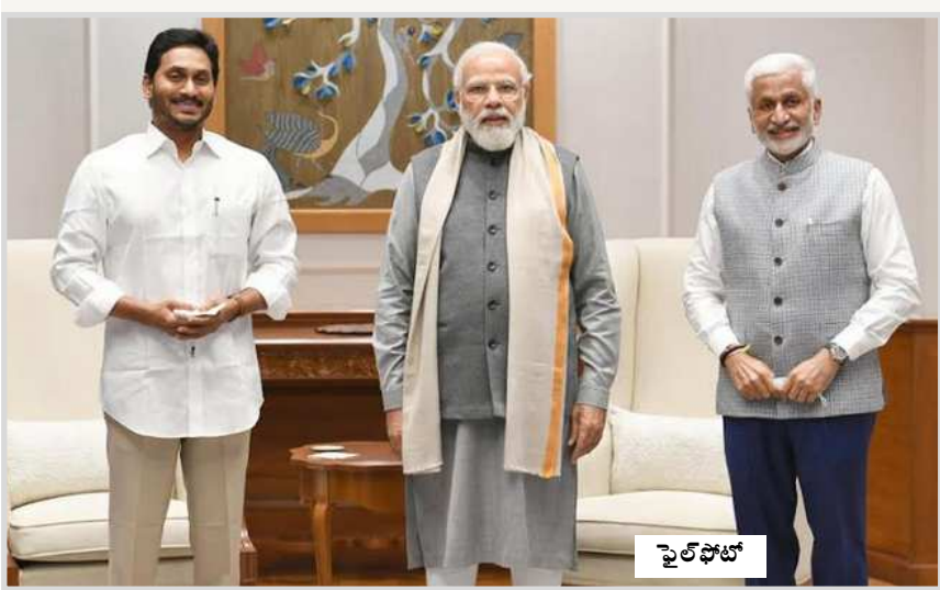
న్యూఢిల్లీ /విశాఖపట్నం (విజయభాను న్యూస్) : రాష్ట్ర అభివృద్ధి అజెండాగా సీఎం జగన్ మోహన్ రెడ్డి రెండురోజుల ఢిల్లీ పర్యటన సాగిందని రాజ్యసభ సభ్యులు విజయసాయిరెడ్డి అన్నారు. బుధవారం పలు అంశాలపై విజయసాయిరెడ్డి ఢిల్లీలో వేదికగా స్పందించారు. రాష్ట్రాభివృద్ధికి కీలకమైన పలు పెండింగ్ ప్రాజెక్టులపై ప్రధాని నరేంద్రమోడీతో విస్తృతంగా చర్చించిన సీఎం జగన్ పలువురు కేంద్ర మంత్రులను