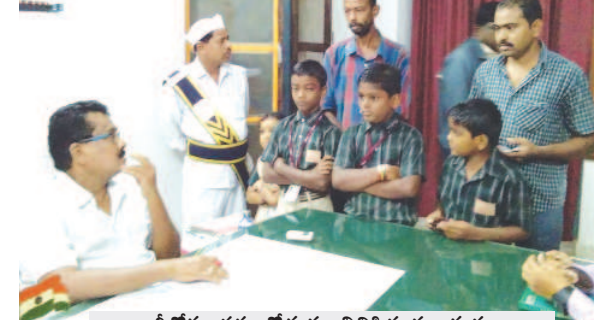
ఆర్డీవోకు తమ గోడును వినిపిస్తున్న దృశ్యం

- 24 గంటల్లో స్పందించకపోతే చర్యలు తప్పవు - ఫోన్లో స్కూల్ యాజమాన్యాన్ని ఆదేశించిన ఆర్డీవో