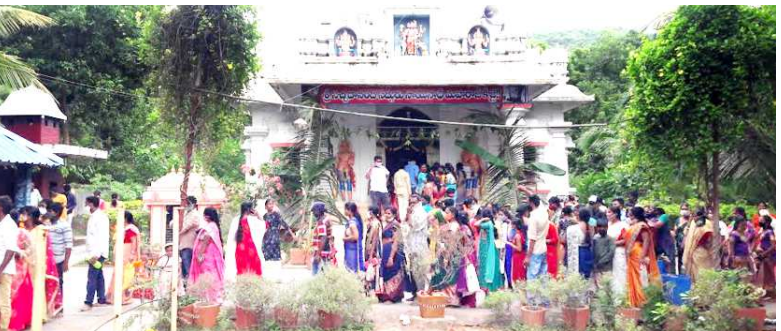
ఆలయం వద్ద భారులు తీరిన భక్తులు