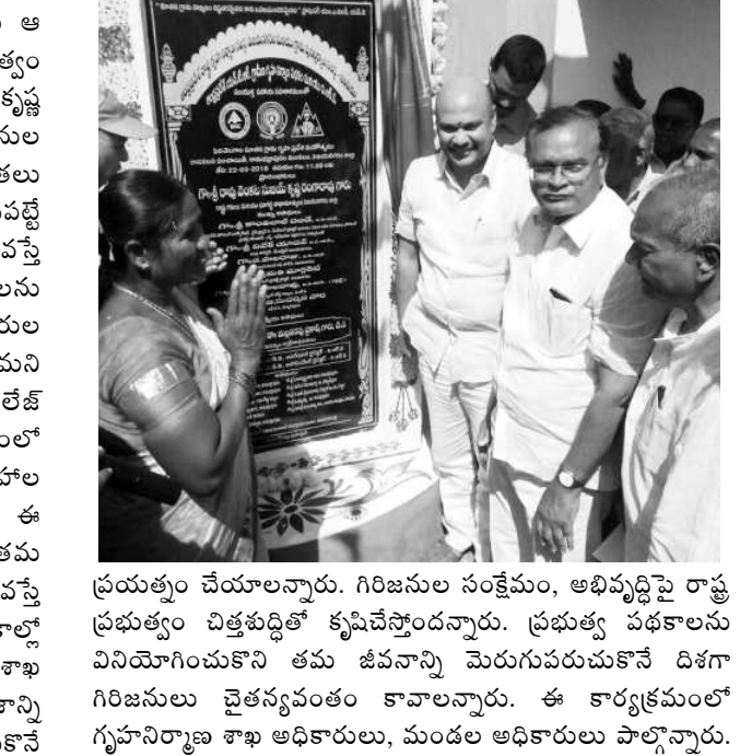
ప్రయత్నం చేయాలన్నారు. గిరిజనుల సంక్షేమం, అభివృద్ధిపై రాష్ట్ర ప్రభుత్వం చిత్తశుద్ధితో కృషిచేస్తోందన్నారు. ప్రభుత్వ పథకాలను వినియోగించుకొని తమ జీవనాన్ని మెరుగుపరచుకోవే దిశగా గిరిజనులు చైతన్యవంతం కావాలన్నారు. ఈ కార్యక్రమంలో గృహనిర్మాణ శాఖ అధికారులు, మండల అధికారులు పాల్గొన్నారు.

విజయనగరం : రాష్ట్రంలోని ఏజెన్సీ ప్రాంతాల్లో లభించే ఖనిజాల తవ్వకానికి సంబంధించిన నిర్వహణ బాధ్యతలను ఆ ప్రాంత గిరిజనులకే పూర్తిగా అప్పగించేందుకు రాష్ట్ర ప్రభుత్వం సిద్ధంగా వున్నట్లు రాష్ట్ర గనులశాఖ మంత్రి ఆర్.వి.సుజయ్ కృష్ణ రంగారావు వెల్లడించారు. గనుల తవ్వకం ద్వారా గిరిజనుల ఆదాయాలను పెంచే ఉద్దేశ్యంతోనే గనుల నిర్వహణ బాధ్యతలు వారికి అప్పగిస్తున్నట్లు మంత్రి చెప్పారు. గనుల తవ్వకం చేపట్టే గిరిజనులు ముందుగా ఒక సొసైటీగా ఏర్పడి ముందుకు వస్తే వారికి వారు నివసించే ప్రాంత పరిసరాల్లోని గనులను అప్పగిస్తామని, గనుల నిర్వహణలో వారికి తమ శాఖ అధికారుల సుండి పూర్తి సహకారం అందించేలా చర్యలు చేపడతామని పేర్కొన్నారు. సొలారు మండలం పెదశెలగాంలో విలేజ్ రికన్స్ట్రక్షన్ ఆఫ్ఫైజులో ఆన్ లైన్లో ఎన్.టి.ఆర్.గ్రామీణ పథకంలో నిర్మించిన నలభై నివాస గృహాల సమదాయాన్ని మంత్రి గురువారం ప్రారంభించారు. ఈ సందర్భంగా మాట్లాడుతూ పెదశెలగాం గిరిజనులు తమ పరిసరాల్లోని గనులను నిర్వహించేందుకు ముందుకు వస్తే అనుమతులు ఇస్తామన్నారు. గిరిజనులకు గనుల తవ్వకాల్లో అవసరమైన సాంకేతిక సహకారాన్ని, వైపుబాగాన్ని గనుల శాఖ అందిస్తుందని చెప్పారు. గిరిజనులంతా ఈ అవకాశాన్ని వినియోగించుకొని తమ జీవన ప్రమాణాలు మెరుగుపరచుకోవే