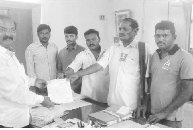
చంద్రన్న మరో ముందడుగులో భాగంగా దళిత తేజం-తెలుగుదేశం కార్యక్రమం