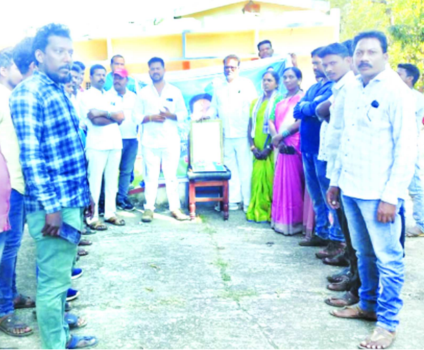
మండలంలో పలు పంచాయితీ సచివాలయాల్లో జగన్ పుట్టినరోజు సందర్భంగా కేక కట్ చేశారు.