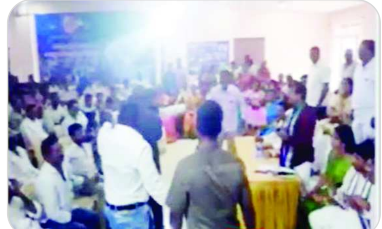
విశాఖ నీటి వైకాపా జాతీయ ప్రధాన కార్యదర్శి ఎంపీ విజయసాయి రెడ్డి విశాఖ సగర కార్యాలయంలో ఏర్పాటు చేసిన వార్డు, బూత్ స్థాయి సమీక్షా సమావేశంలో వైకాపా దక్షిణ నియోజకవర్గ అంతర్గత విభేదాలు బయటపడ్డాయి. ఈ నియోజకవర్గంలో కొంతమంది వ్యక్తులు పార్టీ నిబంధలు ఉల్లంఘిస్తూ పని చేస్తున్నారని నియోజకవర్గ