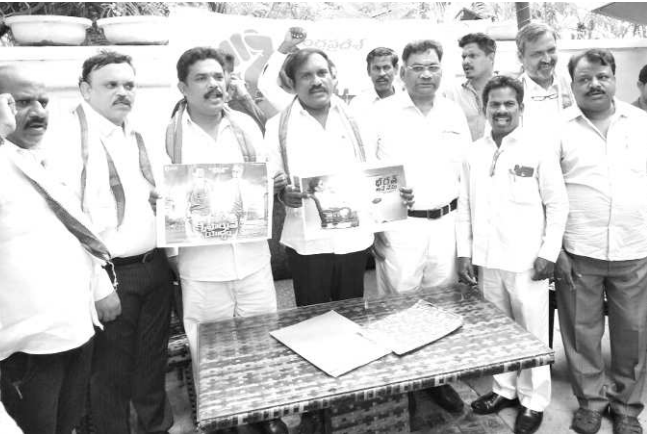
విశాఖపట్నం: హోదా ఉద్యమానికి సిసీ పరిశ్రమ మద్దతు ఇవ్వాలని ఆంధ్రప్రదేశ్ ప్రత్యేక హోదా పేరిట సమితి డిమాండ్ చేసింది. పెద్ద ఎత్తున ఉద్యమం