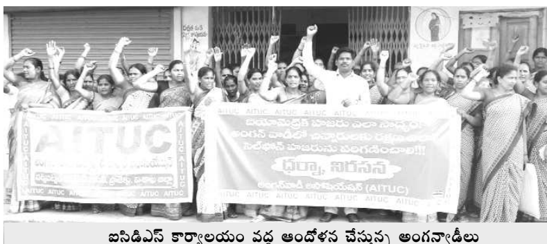
ఐసిడిఎస్ కార్యాలయం వద్ద ఆందోళన చేస్తున్న అంగన్వాడీలు