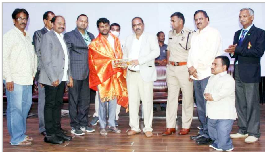
కె. ఎల్ యూనివర్సిటీ లో జరిగిన 34వ నేషనల్ అండ్ 8 ఇయర్స్ ఓపెన్ బాల, బాలికల చెస్ టోర్నమెంట్ కు ముఖ్య అతిథిగా పాల్గొన్న వై ఎక్సలెంట్ రెడ్డి.

భారతదేశ స్వాతంత్ర్యం మరియు దాని ప్రజలు, సంస్కృతి మరియు విజయాల యొక్క అద్భుతమైన చరిత్రను జరుపుకోవడానికి మరియు సృష్టించుకోవడానికి భారత ప్రభుత్వం ప్రారంభించిన ఆజాది కా అమృత్ మహోత్సవం జరుపుకోవడానికి ఎఫ్ ఎస్ ఎస్ ఏ ఈ మేళా నిర్వహించింది. ఈ కార్యక్రమాల ద్వారా, ఆరోగ్యకరమైన మరియు సుసంపన్నమైన భారతదేశం కోసం సురక్షితమైన, ఆరోగ్యకరమైన మరియు స్థిరమైన ఆహారం అనే సందేశాన్ని ప్రచారం చేయడం ముఖ్య ఉద్దేశం.