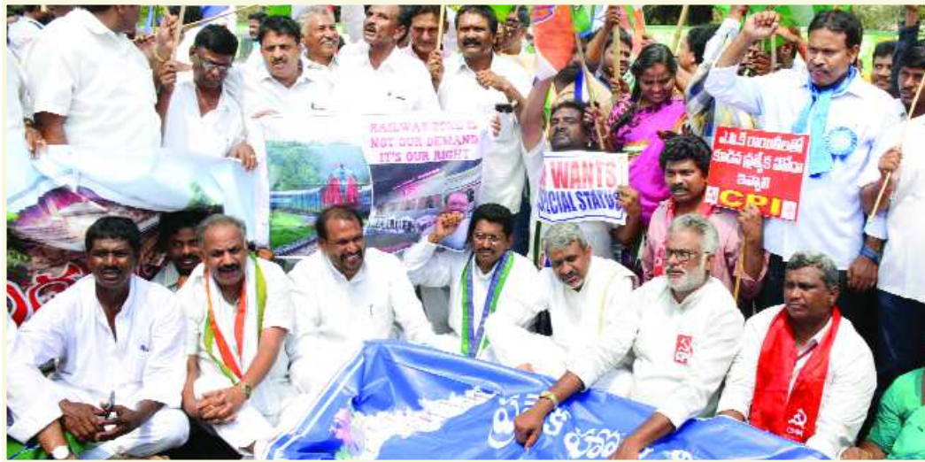
అమరావతి/విశాఖపట్నం: ఆంధ్రప్రదేశ్ ప్రత్యేక దిగ్బంధం చేపట్టింది. ఉదయం 10 గంటలకు హోదా, విభజన హామీల అమలు కోసం ప్రత్యేక హోదా ప్రారంభమైన ఈ నిరసన మధ్యాహ్నం 12 గంటల వరకు సాధన సమితి గురువారం జాతీయ రహదారుల కోసం సాగింది. రాష్ట్రవ్యాప్తంగా జాతీయ రహదారుల్ని

ప్రత్యేక మోదా రాకుంటే ప్రాణ త్యాగానికైనా సిద్ధమే