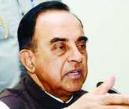
దిల్లీ: భాజపా ఎంపీ సుబ్రహ్మణ్యస్వామి మరోసారి సూపర్ స్టార్ రజనీకాంత్ పై వివాదాస్పద వ్యాఖ్యలు చేశారు. ఇటీవల రజనీ వైద్యపరీక్షల నిమిత్తం అమెరికాకు వెళ్లిన సంగతి తెలిసింది.

అక్కడ రజనీ ఓ క్యానినోలో కూర్చున్న ఫోటోను స్వామి తన ట్వీట్లో పోస్ట్ చేశారు. వాచ్..! రజనీకాంత్ అమెరికాలోని ఓ క్యానినోకి వెళ్లారు. తన ఆరోగ్యం కుదుటపడాలని గ్యాంబ్లింగ్ చేస్తున్నారేమో. రజనీకి అంత డబ్బు ఎక్కడిదో ఈ డి వెంటనే విచారణ చేపట్టాలి అంటూ ట్వీట్ చేశారు. ఇదివరకు కూడా రజనీపై సుబ్రహ్మణ్య స్వామి సంచలన వ్యాఖ్యలు చేసి వార్తల్లో నిలిచారు. తల్లివారా రాజకీయ అరంగేట్రంపై స్వామి స్పందిస్తూ.. ఆయన నిజంగానే తమిళ వ్యక్తి అని నిరూపించుకోవాలని, రాజకీయాల్లోకి వస్తే వ్యవస్థ నాశనమవుతుందన్నారు. అంతేకాకుండా రజనీ రాజకీయాలకు పనికారంటూ వ్యాఖ్యానించిన విషయం తెలిసింది.