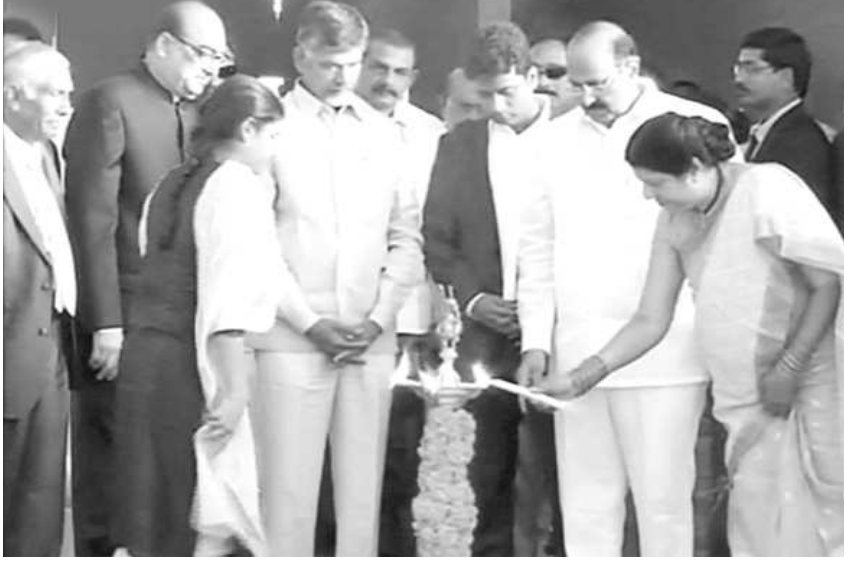
అమరావతి: మరో ప్రతిష్టాత్మక వైద్య విజ్ఞాన సంస్థ ఏర్పాటుకు అమరావతి వేదికగా నిలిచింది. అమరావతి అమెరికన్ ఆస్పత్రి నిర్మాణానికి గురువారం ఆంధ్రప్రదేశ్ ముఖ్యమంత్రి చంద్రబాబు నాయుడు శంకుస్థాపన చేశారు. విజయవాడ సమీపంలోని ఇబ్రహీంపట్నంలో 20 ఎకరాల స్థలంలో ఈ ఆస్పత్రి నిర్మాణానికి ప్రవాసాంధ్రులు ముందుకువచ్చారు. తరువాయి 2లో