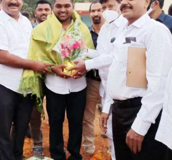
సన్మానించారు. ఆయన రాసున్న రోజుల్లో మరన్నీ పదవులు పొందాలని పలువురు వక్తలు అకాక్షించారు.