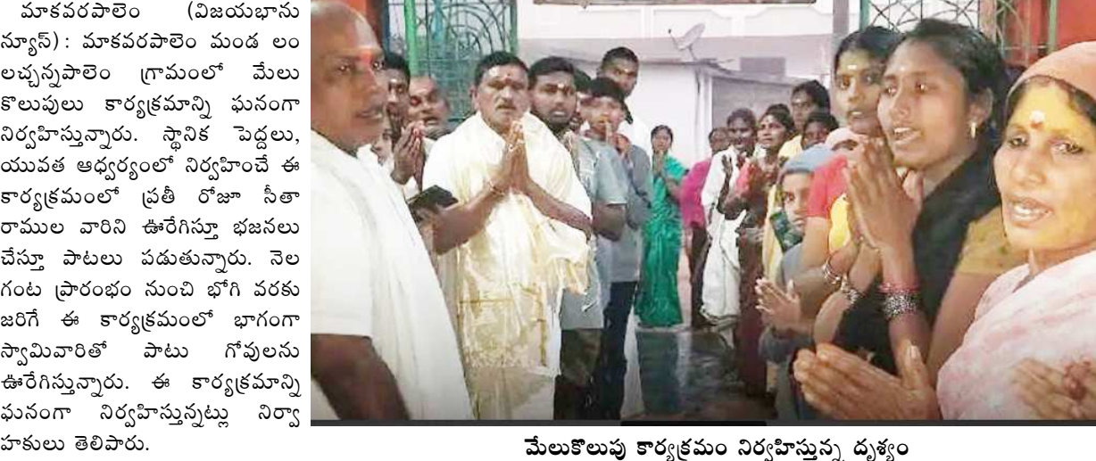
మేలుకొలుపు కార్యక్రమం నిర్వహిస్తున్న దృశ్యం

పద్ధతిలో రెగ్యులర్ చేయాలని వారు డిమాండ్ చేశారు. ప్రస్తుత ప్రభుత్వం ఏర్పడి రెండున్నర సంవత్సరాలు అవుతున్నా కాంట్రాక్ట్ బెట్ సోల్సింగ్ ఉద్యోగుల పట్ల నిర్లక్ష్యం చూపడం తగదని రెగ్యులర్ ఉద్యోగులకు కల్పిస్తున్న అన్ని సౌకర్యాలను కాంట్రాక్ట్ బెట్ సోల్సింగ్ సిబ్బందికి కల్పించాల్సిన అవసరం ఉందని వారు డిమాండ్ చేశారు. ప్రభుత్వం పరిధిలోని వివిధ శాఖల్లోని కాంట్రాక్ట్ అవుట్స్థ్రింగ్ , పార్ట్ టైం సిబ్బంది అందరూ ఒక తాటిపైకి వచ్చి తమ సమస్యల పరిష్కారానికై రోడ్డు పైకి వచ్చి ఉద్యమాలు చేయవలసి ఉంటుందని , అన్ని శాఖల్లోని కాంట్రాక్ట్ అవుట్స్థ్రింగ్, పార్ట్ టైం సిబ్బంది అందరూ దీనికి నిష్ఠగా ఉన్నారని ఆ పరిస్థితి రాకుండా ప్రభుత్వం కాంట్రాక్ట్ అవుట్స్థ్రింగ్, పార్ట్ టైం సిబ్బంది పట్ల స్వయంపరమైన డిమాండ్కు పరిష్కారించాలని వారు పత్రికాముఖంగా ప్రభుత్వాన్ని డిమాండ్ చేశారు.