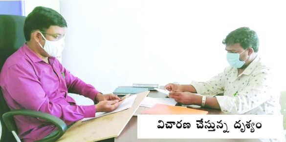
విచారణ చేస్తున్న దృశ్యం