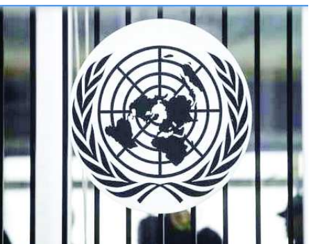
న్యూఢిల్లీ: కేరళ, కర్ణాటకల్లో ఐసిస్ ఉగ్రదాడులు గణనీయమైన సంఖ్యలో ఉన్నట్లు