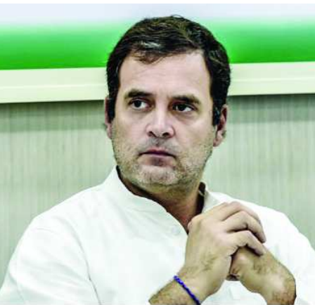
దిల్లీ : కాంగ్రెస్ అగ్రనేత రాహుల్ గాంధీ మరోసారి మోడీ ప్రభుత్వంపై విరుచుకుపడ్డారు. ఇది 'పేదల వ్యతిరేక ప్రభుత్వమని.. కరోనా మహమ్మారి సమయంలో కూడా లాభాల కోసం చూస్తున్నారని తీవ్రస్థాయిలో ద్వజమెత్తారు.

లాక్ డౌన్ సమయంలో వలస కార్మికులను వారి వారి స్వస్థలాలకు చేర్చింది కు తీసుకువచ్చిన శ్రామిక ప్రత్యేక రైల్వే ద్వారా జూలై 9నాటికి రూ.429 కోట్ల ఆదాయం సమకూరినట్లు రైల్వే శాఖ వెల్లడించింది. ఈ ప్రకటనపై రాహుల్ తీవ్ర విమర్శలు చేశారు. 'ఓ వైపు మహమ్మారి విరుచుకుపడుతోంది.. మరోవైపు ప్రజలు తీవ్ర ఇబ్బందుల్లో ఉన్నారు. ఈ పేదల వ్యతిరేక ప్రభుత్వం విపత్తుల సమయంలోనూ లాభాల్ని ఆశిస్తోంది.' అంటూ రాహుల్ ట్వీట్ లో విరుచుకుపడ్డారు. రైల్వే ఆదాయానికి సంబంధించిన నివేదికను దీనికి జత చేశారు. దేశంలో శ్రామిక రైల్వే వలస కార్మికుల కోసం మే 1 నుంచి కేంద్ర ప్రభుత్వం నడుపుతోంది. జూలై 9 వరకూ 4,496 ప్రత్యేక రైళ్లను నడిపారు. దాదాపు 6.3 మిలియన్ ప్రజలను వారి స్వస్థలాలకు చేర్చారు.