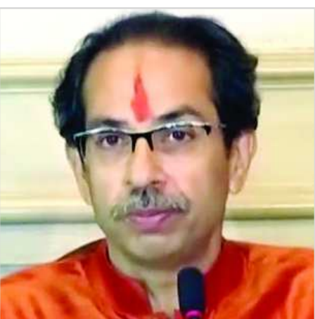
ముంబయి: ఆర్థిక వ్యవస్థ నష్టపోతుందని రాష్ట్రంలో పూర్తిగా లాక్ డౌన్ ఎత్తేసేందుకు తాను సుముఖంగా లేనని మహారాష్ట్ర ముఖ్యమంత్రి ఉద్ధవ్ ఠాకే అన్నారు. మహమ్మారి కారణంగా సవాళ్లు ఎదురవుతున్నా ఆర్థిక, ఆరోగ్య వ్యవస్థల వ్యవస్థ సమతులకం సాధించడం అవసరమని పేర్కొన్నారు. శివసేన పార్టీ అధికార పతీకతో ఆయన మాట్లాడారు. 'పూర్తిగా లాక్ డౌన్ ఎత్తేస్తామని వేచివుడ్డా అనలేదు. కొద్దికొద్దిగా తెరుస్తామని చెప్పారు. ఒకసారి తెరిచాక మళ్ళీ మూసేయొద్దన్నది నా ఉద్దేశం. దళవారిగా

వ్యాపారాలను తెరిచేందుకు చర్యలు తీసుకుంటున్నాను. ఆర్థిక వ్యవస్థ, ఆరోగ్యమా అని ఆలోచించకూడదు. రెండింటి మధ్య సమతులకం అవసరం. ఈ మహమ్మారి ప్రపంచ యుద్ధంలాంటిది. అన్ని దేశాలూ దీని బారిన పడ్డాయి. వైస్ ప్రభావం పొందిందని ఆర్థిక వ్యవస్థలు తెరిచిన దేశాలు ఇప్పుడు మళ్ళీ అంక్షలు విధిస్తున్నాయి. ఆస్ట్రేలియాలో సైన్యాన్ని రంగంలోకి దించారు' అని ఉద్ధవ్ అన్నారు. 'చాలామంది లాక్ డౌన్ ను వ్యతిరేకిస్తున్నారు. ఆర్థిక వ్యవస్థపై ప్రభావం పడుతుందని అంటున్నారు. వారిని నేనక్కడే ప్రశ్ని అడుగుతున్నాను. లాక్ డౌన్ ఎత్తేశాక ప్రజలు చనిపోతే వారు బాధ్యత వహిస్తారా? ఆర్థిక వ్యవస్థపై మరూ బాధ్యత వహిస్తారా? ఆర్థిక ముంబయిలో సబర్బన్ రైల్వే నెట్ వర్క్ పునః ప్రారంభం గురించి ప్రశ్నించగా 'వారి కుటుంబాలు అస్సన్నతకు గురై ఇళ్ళన్నీ తాళం వేయాలి వస్తే పరిస్థితి ఏంటి? అందుకే ప్రతిదీ దళవారిగా చేయాలంటున్నాం' అని పేర్కొన్నారు. మహావికాస్ అపూడి ప్రభుత్వ సవాళ్లు, ప్రతిపక్షాల గురించి ఆయన మాట్లాడారు.