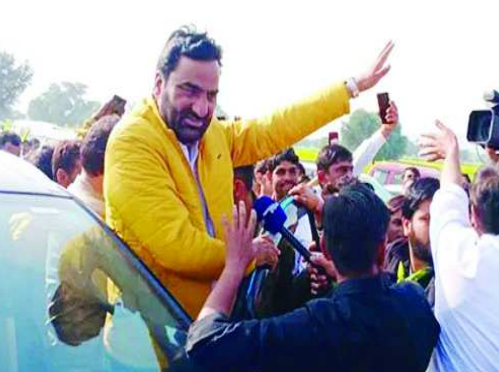
దిల్లీ: భాజపా నేతృత్వంలోని ఎన్టీయే కూటమి నుంచి మరో పార్టీ వైదొలిగింది. రాజస్థాన్ లోని హనుమాన్ జేసీవల్ నేతృత్వంలోని రాష్ట్రీయ లోకతాండ్రక్ పార్టీ (ఆర్ఎల్పీ) కూటమి నుంచి బయటకొచ్చింది. నూతనంగా తీసుకొచ్చిన రైతు చట్టాలను వ్యతిరేకిస్తూ

కూటమి నుంచి వైదొలుగుతున్నట్లు జేసీవల్ ప్రకటించారు. రైతులకు వ్యతిరేకంగా వ్యవహారించేవారి పక్షాన తాము ఉండబోమని తెలిపారు. రాజస్థాన్ లోని ఆల్టర్ జిల్లాలో నిర్వహించిన రైతుల ఆందోళన కార్యక్రమంలో ఈ మేరకు జేసీవల్ ప్రకటన చేశారు.