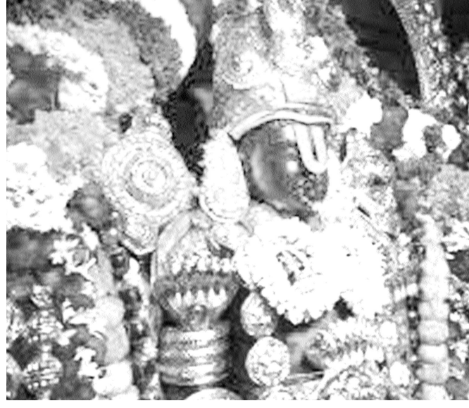
భగవంతుడు సాధు రక్షణార్థం, ధర్మ సంస్థాపనార్థం ఏ రూపంలోనైనా గోచరించగలడు. అదే భగవంతుని

అవతార విశిష్టత. ఆయనను సంపూర్ణంగా విశ్వసించకపోతే బాధపడక తప్పదు. విశ్వసిస్తే ఆత్మగత సంబంధం ఏర్పడుతుంది. దేవుడి శక్తి మనలో నిండి ఉంటుంది. కనుక అప్పుడు ఎవరోనైనా దైవత్వం కనపడుతుంది. ఇలాంటి భావం అందరిలో ఏర్పడకపోవడానికి కారణం, దేవుడు లేడని కాదు మనకు దేవుడు కనపడాలన్న కోరిక బలంగా లేకపోవడం. కోరికలు మహారాజును కూడా కటిక పేదరాడిగా మార్చ గలవు. కనుక భక్తులు కోరికలకు దూరంగా భగవంతుడికి దగ్గరగా ఉండేందుకు ప్రయత్నించాలి. మనకు అవసరమైనవన్నీ భగవంతుడే అడక్కుండా సమకూరుస్తాడు. మనం కొరకున్న కోరికలలో ఏవైనా తీర లేదంటే అవి మనకు మేలు చేయనివని దేవునికి అని వింది ఉండాలి. అందుకే పరమాత్మ మనకు అను