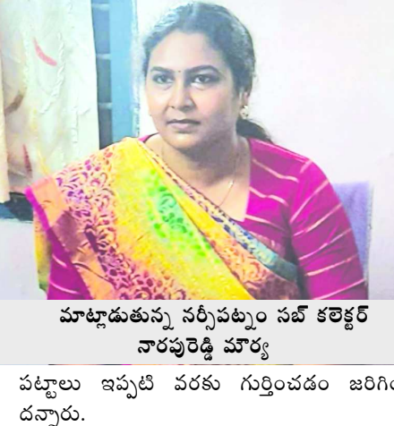
పట్టాలు ఇప్పటి వరకు గుర్తించడం జరిగిందన్నారు.

నర్సపట్నం : భూచట్టాలపై సమగ్ర సర్వే చేయడం ద్వారా రైతులకు ఎంతగానో మేలు జరుగుతుందని నర్సపట్నం సబ్ కలెక్టర్ నారపురెడ్డి మార్క అన్నారు. శనివారం గొలుగిండ విచ్చేసిన ఆమె మండల రెవెన్యూ కార్యాలయంలో విలేకర్లతో మాట్లాడారు. 8 సర్వే దాతల గతంలో నుండి ఉప్పటువంటి భూసమస్యలపై వెంటనే చర్యలు తీసుకోవడం వలన రైతులకు ఎంతగానో ఉపయోగ పడుతుందన్నారు. డివిజన్లో 10 సెంటర్లుగా విభజించి సర్వే ద్వారా రైతుల సమస్యల మూడు రోజుల్లో మండల అధికార్లు చర్యలు తీసుకోవడం జరుగుతుందన్నారు. గొలుగిండ మండలానికి సంబంధించి 1578 హోసింగ్