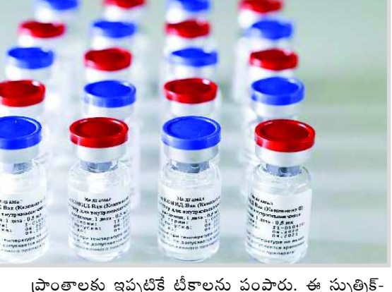
ప్రాంతాలకు ఇప్పటికే టీకాలను పంపారు. ఈ స్పర్మిక్-వి టీకా ఎగుమతికి సంబంధించి రష్యా ఇప్పటికే చాలా దేశాలతో ఒప్పందాలు చేసుకుంది. ఇప్పటికే అర్జెంటీనా, బెలారస్ లు తమ దేశాల్లో స్పర్మిక్ టీకా వినియోగాన్ని అనుమతించారు.

మాస్కో: 60 ఏళ్లు పైబడిన వారికి ఇకపై స్పర్మిక్ టీకాను అందించేందుకు రష్యా అనుమతించింది. రష్యాలో అత్యవసర వినియోగం కింద స్పర్మిక్ వ్యాక్సిన్ను అక్కడి ఔషధ నియంత్రణ సంస్థ అనుమతిచ్చిన విషయం తెలిసింది. ఇప్పటికే దాదాపు రెండు లక్షలమందికి పైగా టీకాను పంపిణీ చేశారు. వారిలో 60 ఏళ్లు పైబడిన వారికి టీకాను అనుమతించలేదు. ఆ వయసు వారిపై ఈ టీకాను విడిగా పరీక్షించారు. ఈ ప్రయోగ పరీక్షల్లో మెరుగైన ఫలితాలు సమోదు చేయడంతో రష్యా ఆరోగ్య శాఖ మంత్రి టీకాను అందరికీ అనుమతిస్తూ శనివారం ఆదేశాలు జారీ చేశారు. కాగా రష్యా ప్రభుత్వం 3 లక్షల స్పర్మిక్ టీకాలను అర్జెంటీనాకు పంపారు. రష్యా వ్యాప్తంగా టీకా పంపిణీ కార్యక్రమం జరుగుతుండటంతో దేశంలోని అన్ని