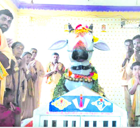
నరసాపురంలో శ్రీ లక్ష్మీ నరసింహ స్వామి వారి కళ్యాణోత్సవం నిర్వహిస్తున్న భక్తులు | కళ్యాణ శ్రీ లక్ష్మీ నరసింహ స్వామి వారు | సింహాద్రి అప్పన్నకు (తొలి పెద్ద) పూజలు చేస్తున్న సింహాద్రి అప్పన్న మాలధారులు

చోడవరం : ముక్కోటి ఏకాదశి సందర్భంగా మండలంలోని నరసాపురం గ్రామంలో సింహాద్రి అప్పన్న ఆలయంలో శుక్రవారం రాత్రి శ్రీ లక్ష్మీ నమేత నరసింహ స్వామి వారి కళ్యాణ మహోత్సవ కార్యక్రమం అత్యంత వైభవంగా కమ్మల పండుగగా నిర్వహించారు.