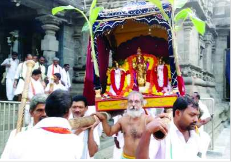
సింహాద్రి అప్పన్నకి తనసోదరి శ్రీ పైడితల్లి అమ్మవారి కుమార్తెతో వివాహం కుదిరింది

ప్రతియేడు అప్పన్న కళ్యాణోత్సవానికి ముందు పాల్గుణ శుద్ధ పౌర్ణమినాడు నిర్వహించే ఉత్సవం డోలోత్సవం దీన్నే భక్తులు వాడుకలో బొట్టినడిగి పుస్తమిగా నానుడి. డోలోత్సవం పురషురించుకొని సింహాద్రినాథున్ని వేకువజామున సుప్రభాతసేవతో మేల్కొల్పి అనంతరం ప్రత్యేక పూజలు అనంతరం స్వామివారి ఉత్సవమూర్తులైన గోవిందరాజస్వామివారిని ఉభయదేవరులను సుందరంగా అలంకరించి మెట్టమార్గం గుండా కొండాద్రిగుండు పుష్పరిణి మండపానికి చేర్చి స్వామివారిని పెళ్ళికొడుకుగా నిర్ణయించి సోదరి పైడితల్లివద్దకు వెళ్ళి పెళ్ళికి పిల్లని అడుగగా సోదరి నిరాకరించగా మరల ప్రత్యేక చర్చలు జరిపి సోదరిని వచ్చించడంతో సోదరి కుమార్తెను ఇచ్చుటకు సమ్మతి తెలియజేయడంతో స్వామివారు పెళ్ళికుదిరిన ఆనందంతో తన వెంటబుట్ట బృందంతో రంగులుజల్లుకొని ఉత్సవం జరుపుకుంటారు. ఈ ఉత్సవాన్ని వైదికులు డోలోత్సవం వసంతోత్సవం చువర్ణోత్సవం కార్యక్రమాన్ని వోకరిపై వోకరు రంగులు జల్లుకుంటూ వైదికులు ఇతర దేవస్థాన సిబ్బంది ఆనందోత్సాహాలతో ఎంతో సంబరంగా జరుపుకున్నారు. అనంతరం గ్రామ తిరువిధిలో భక్తులకు దర్శనభాగ్యం కల్పించి మరల మెట్టమార్గం గుండా సింహాద్రికిచేరుకున్నారు. ఈ కార్యక్రమంలో భారీ ఎత్తునభక్తులు హాజరై స్వామివారికి ఫల పుష్పాలు సమర్పించారు.