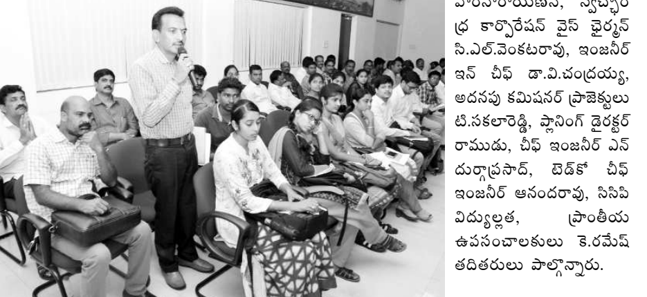
పనులను నాలుగు నెలల వ్యవధిలో పూర్తిచేయాలని కోరారు.