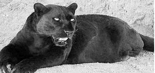
సిమ్లిపాల్ అడవులో నల్లచిరుతలు కనిపించినట్లు ప్రచారంలో ఉన్నా ఆ సమయంలో కెమెరాలు లేకపోవడం వల్ల వాటిని నిర్ధారించలేదు.

భువనేశ్వర్: ఒడిశాలోని సుందర్ గట్ అటవీప్రాంతంలో అరుదైన నల్ల చిరుత కనిపించినట్లు అటవీ అధికారులు తెలిపారు. అటవీ డివిజన్ లోని గర్లనహాడ్ రిజర్వ్ అడవిలో ఏర్పాటు చేసిన కెమెరాలో నల్లచిరుత సంచరిస్తున్న దృశ్యాలు నమోదైనట్లు వారు ప్రకటించారు. దేశంలో అంతకుముందు కేరళ, కర్ణాటక, తమిళనాడు, ఆసాం, అరుణాచల్ ప్రదేశ్ లో సహా ఎనిమిది రాష్ట్రాల్లో నల్లచిరుత కనిపించగా.. తాజాగా ఒడిశా ఆ జాబితాలోకి చేరింది. 22 ఏళ్ల క్రితం ఒడిశాలోని పూర్ బని,