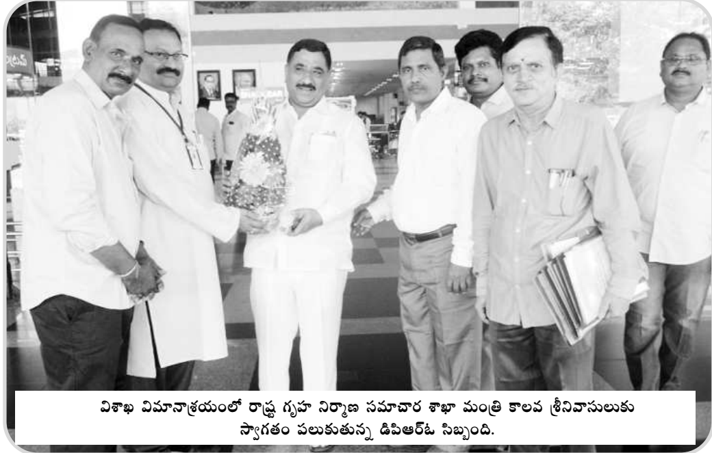
విశాఖ విమానాశ్రయంలో రాష్ట్ర గృహ నిర్మాణ సమాచార శాఖ మంత్రి కాలవ శ్రీనివాసులుకు స్వాగతం పలుకుతున్న డివిఆర్ఓ సిబ్బంది.