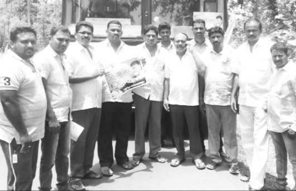
ధర్మపోరాట దీక్షకు వెళుతున్న నాతవరం నాయకులు