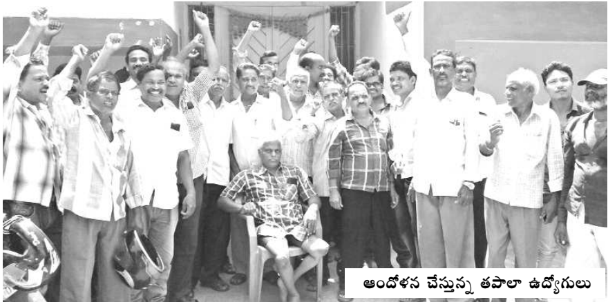
అందోళన చేస్తున్న తపాలా ఉద్యోగులు

నర్సేపట్నం : దేశవ్యాప్తంగా గ్రామీణ ప్రాంత తపాలా కార్యాలయాల్లో పని చేస్తున్న గ్రామీణ డాక్ సేవర్స్ (జెడిఎస్) కమిటీవేదనల కమిటీ సమన్వయ సామకూల నిఫార్మలను అమలు చేయాలని నర్సేపట్నం తపాలా ఉద్యోగులు మంగళవారం నిరవధిక సమ్మె చేపట్టారు. వేతన కమిటీ నిఫార్మలను వెంటనే అమలు చేయాలని