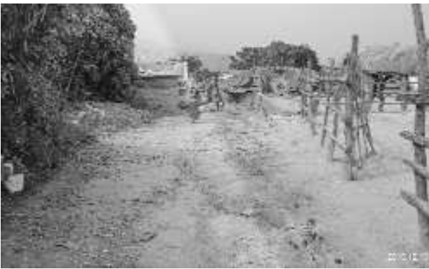
పట్టించుకోవడం లేదని గ్రామస్థులు విలేజ్ కలెక్టర్ సమస్యల కొరకు ఎవ్వరూ ముందు వాపోయారు.

అరకులోయ: మండలం గన్నేల పంచాయతీ కొరంజిగుడ గ్రామంలో సిమెంటు రోడ్డు నిర్మించాలని గ్రామస్థులు ఆవేదన పడుతున్నారు. ఈ 20 ఏళ్ళలో రెండు మూడు ప్రభుత్వాలు అధికారంలో ఎన్నో సార్లు మా పల్లె పరిస్థితి చూశారు. అధికారులు వచ్చారు చూశారు. అయినా మా పల్లె సమస్య ఎవరికీ పట్టడం లేదు. ఓట్ల కోసం అయితే అధికారులు నాయకులు వస్తారు. కానీ మా రోడ్డు పట్టించుకోవడం లేదని గ్రామస్థులు విలేజ్ కలెక్టర్ సమస్యల కొరకు ఎవ్వరూ ముందు వాపోయారు.