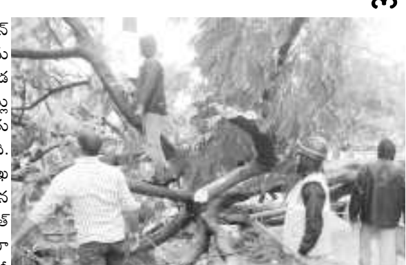
తుపాన్ ప్రభావంతో ఉడయం నుంచి భారీ ఈదురు గాలులు వీచాయి.

నర్సపట్నం: ఫెథాన్ తుపాన్ ప్రభావంతో నర్సపట్నంలో సోమ వారం వీచిన గాలులకు అక్కడ కృష్ణ చెట్లు నేలకొరిగాయి. ఈ చెట్లు విద్యుత్ వైర్లపై పడటంతో విద్యుత్కు తీవ్ర అంతరాయం ఏర్పడింది. మున్సిపల్ సిబ్బంది, విద్యుత్ శాఖ సిబ్బంది ఎప్పటికీ వృథుడు పడిపోయిన చెట్లను తొల గించి విద్యుత్ పునరుద్ధిస్తున్నారు. తుపాన్ ప్రభా వంతో ఉడయం నుంచి భారీ ఈదురు గాలులు వీచాయి. ఒక మోస్తరు వర్షం కూడా పడింది. దీంతో జనజీవనానికి అటంకం ఏర్పడింది.